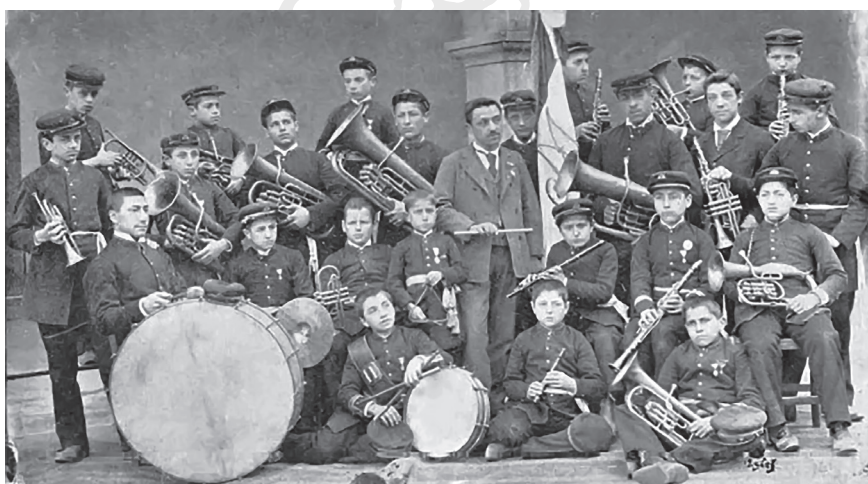
10. Banda, 1894