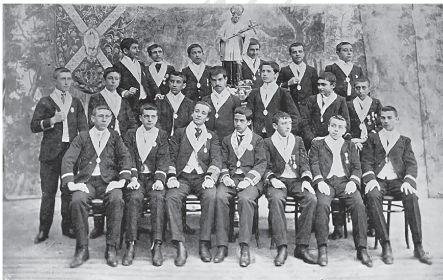
6. Congregantes. 1902-1903.