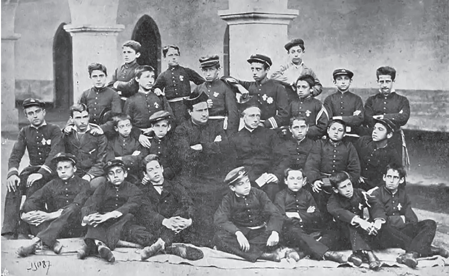
7. Alumnos e Xeometría e Filosofía. 1881