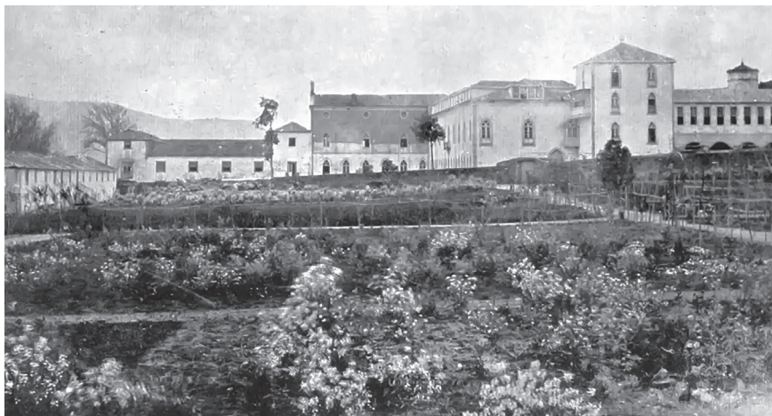
13. Vista do complexo educativo nos seus inicios desde a horta.