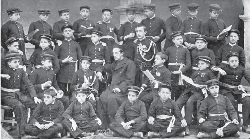
11. Grupo se colexiais, 1893.