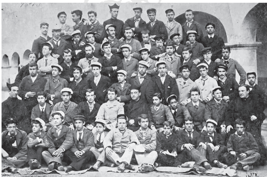
2. Alumnos de Dereito e de Preparatoria de Enxeñeiros. 1882.