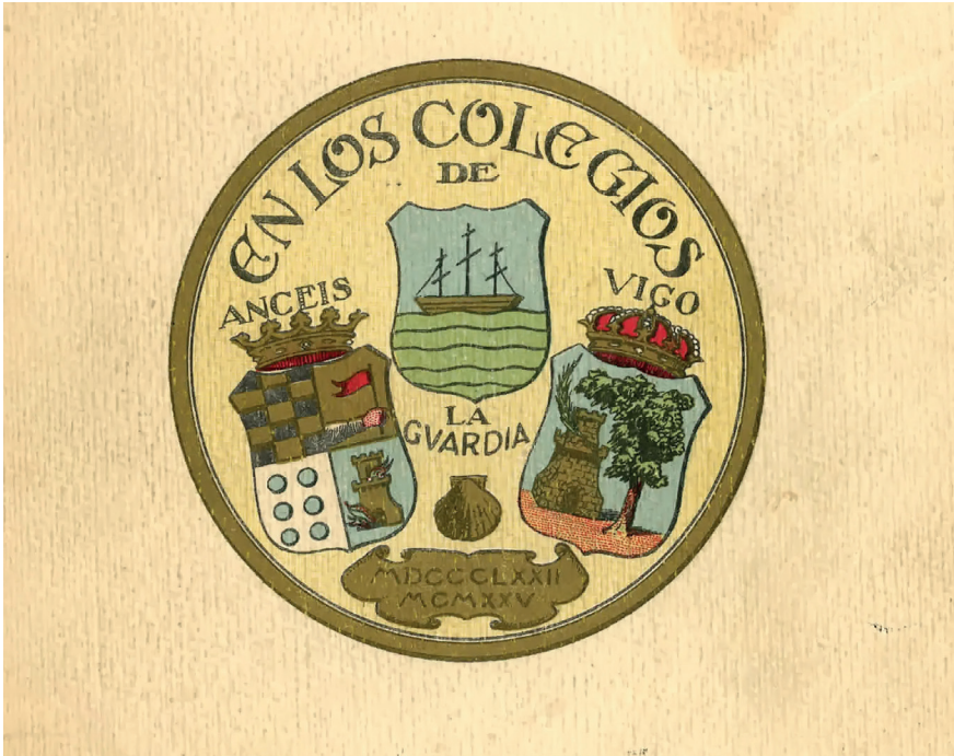
15. Detalle portada do libro-homenaxe.