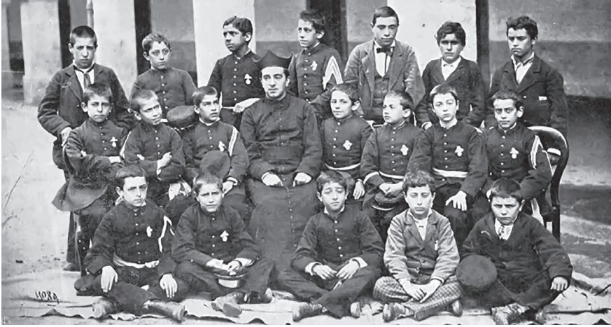
3. Alumnos de Retórica e Matemáticas. Curso 1882-1883.