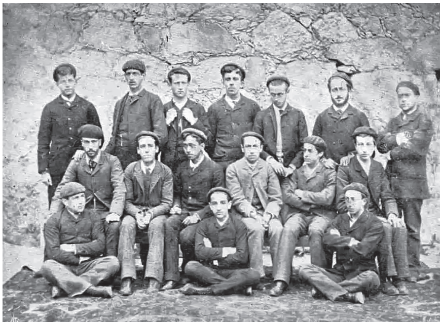
5. Alumnos de Estudios Superiores en 1884-1885. Manuel Portela Valladares de pé, cuarto pola esquerda.