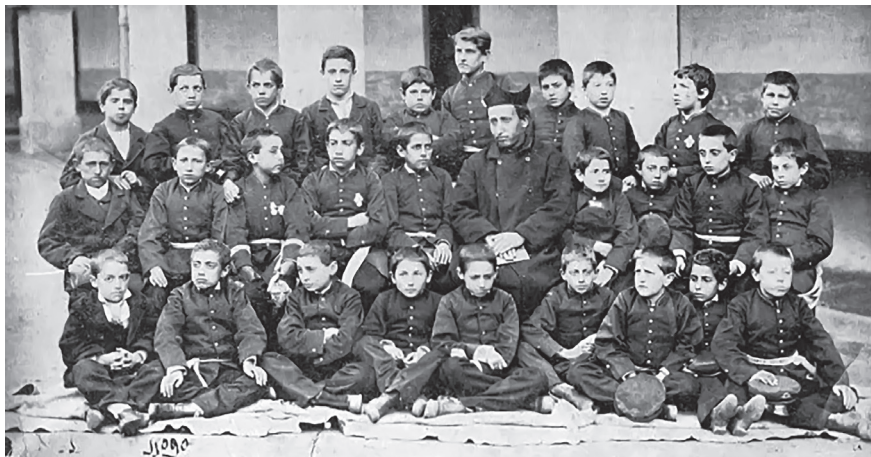
1. Segunda división. Curso 1880-1881