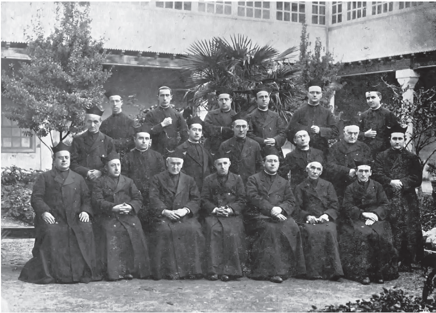
12. A derradeira comunidade. Curso 1915-1916.