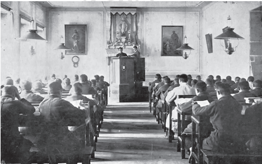
8. Estudo da Primeira División. Curso 1893-1894.