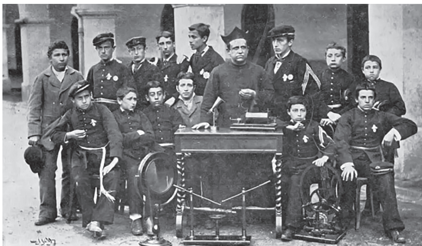
9. Alumnos de Física, 1882-1883