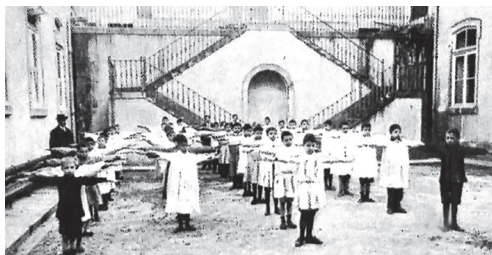
Figura 3. Exercícios de ginástica sueca na escola. (Ilustração Portuguesa, nº 418, 23 de fevereiro de 1914, p. 247, HML).

Por sua vez o avanço científico, encetado em larga escala por Pasteur, aliado ao estado sanitário a que estavam votadas as cidades portuguesas, traduzia-se numa elevada mortalidade, e tornou urgente repensar o higienismo sob o ponto de vista educativo. Esta conjugação de fatores favoreceu a emergência do higienismo escolar, enquanto matéria de ensino e como requisito arquitetónico.