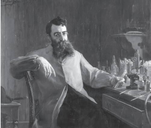
Figura 1. Ricardo Jorge, retrato a óleo por Veloso Salgado. Biblioteca Pública Municipal do Porto. (in ALVES, Jorge. Signo de Hipocrates, 2003).