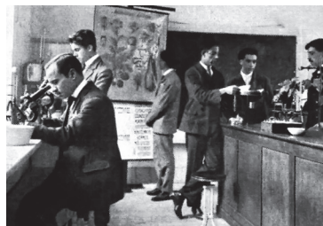
Figura 4. Laboratório de Higiene e tecnologia do Instituto Industrial de Lisboa. (Ilustração Portuguesa, nº 820, 5 de novembro de 1921, p.348. HML).

Segundo Basílio Martins, em inícios do século XX “começavam, assim, a proliferar as políticas educativo-sanitárias no sentido de cuidar não só a higiene do corpo, mas também a higiene da “alma”. Contudo, o mesmo autor refere que “não bastaria o discurso de novas pedagogias e metodologias do ensino, era preciso mais.” 8 É neste contexto que se dá o aprofundamento do discurso higienista, inicialmente na tentativa da afirmação da higiene dotada de um caráter científico e depois como elemento fundamental em contexto escolar.