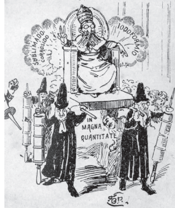
Figura 2. Caricatura de Ricardo Jorge (Inocência VI da Higiene), da autoria de Rafael Bordalo Pinheiro. (in A Paródia, N.º 6, 21 Fev. 1900).