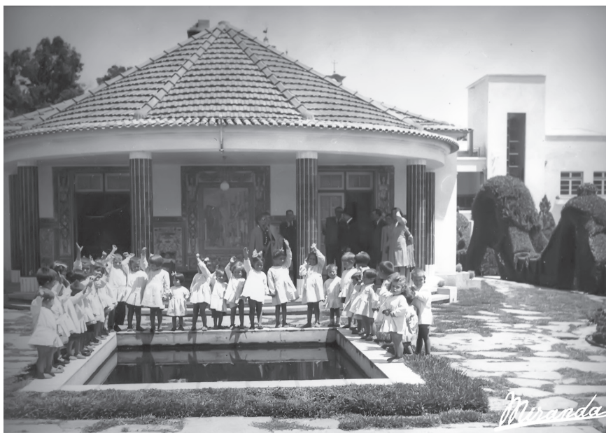
Figura 2. Acesso ao exterior.

em exercício a sua atividade lúdica» 91 , atividades que eram consideradas «fonte de conhecimentos e de disciplina, fator de desenvolvimento do sistema nervoso, meio de correção dos instintos, estímulo contra a preguiça e a indolência» 92 . A importância da vida ao ar livre e a liberdade concedida à criança, em tempo e espaço, para brincar e jogar, afinal, as crianças aprendem brincando. A atividade lúdica, considerada «necessidade imperiosa da criança» 93 , era tida como um valioso instrumento de formação. Evocando Froebel, pensamento e método, reconhecia Bissaya Barreto, um valor educativo à brincadeira e aos brinquedos, salientando as importantes aprendizagens e a significativa experiência que estes lhes proporcionavam. 94