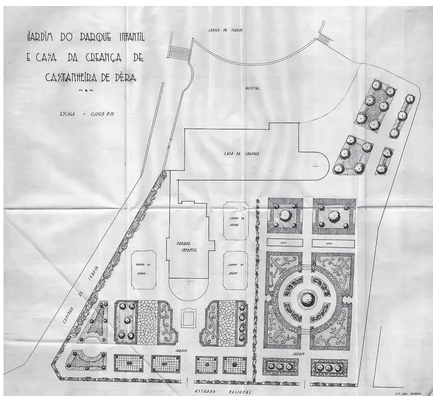
Figura 3. Parque Infantil de Castanheira Pera - jardim.

Em complemento com os campos de jogos existia um espaço ajardinado, de dimensões variáveis, com claros objetivos educativos (figura 4). O jardim, com «valência simbólico-funcional» 95 , com uma estrutura geométrica, sugeria ordem, cuidado e fazia parte integrante do programa educativo das Casas da Criança. Enquanto espaço educativo, o jardim, como salientava Bissaya Barreto, oferecia a possibilidade de contacto com um ambiente atraente e o convívio e a familiaridade com o belo no dia-a-dia, contribuíam para o desenvolvimento do bom gosto. Apelava-se a «uma espécie de instinto da criança» 96 , que, sentindo-se atraída pelo bem, gerasse um amor à beleza que, pela ação educativa, seria incorporado na sua personalidade. Proporcionava aprendizagens no contexto, como sublinhava o criador da Fundação Bissaya Barreto, «as ciências naturais estudam-se na cultura de jardinzinhos, na criação e cuidado de pequenos animais – nossos amigos». 97