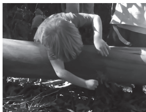
Ilustración 3. Un neno desenvolve un xogo espontáneo con que alimenta un dinosauro solitario, o que se vincula coa aparición dunha gata nas mesmas condicións na escola.