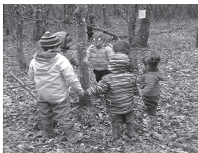
Ilustración 9. Os nenos inician un xogo de corro.