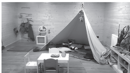
Ilustración 1. Unha das partes da Aula con teito.

Así mesmo, os nenos e as nenas desprázanse camiñando a lugares próximos, coñecendo bosques de piñeiros, muíños, praias... e observando os cantís, a illa da Marola ... cos que dispoñen dunha vinculación emocional, poñéndolles nomes ( Madriqueras, Bosque de las ardillas pillas ...). Ademais, nestes lugares naturais increméntase a sensación de protección. 62