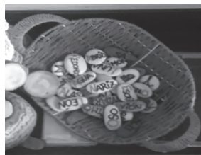
Ilustración 5. Pedras con palabras..