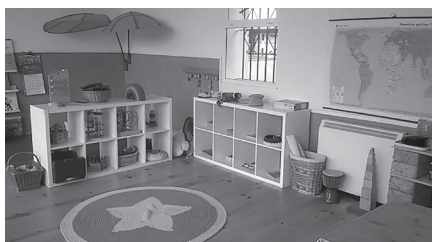
Ilustración 6. Recuncho de construción e material Montessori .

Este divídese nun edificio e o medio natural de arredor. En canto ao inmoible, ten un andar e no pasado acolleu unha escola unitaria. Dispón de varias dependencias, das cales a máis grande é a que se usa como aula (repartida en distintos recantos como o da experimentación plástica, o da construción e material Montessori ...). No referente ao exterior, a poucos metros da porta da escola hai un prado para o xogo libre, tomar o almorzo e coidar dos cultivos do horto. Na parte traseira da escola contan cun bosque de bidueiros e carballos, onde observan as modificacións na paisaxe co paso do tempo (as pólas sen vida tras seren sacudidas polos fortes refachos de vento no inverno, os novos brotes...). Transitando por camiños naturais feitos polos seres vivos do bosque, achan outras zonas (piñeirais, eucaliptais...). Así mesmo, gozan dos elementos da contorna próxima como granxas, castros celtas (como o de Rebordaos)... Deste xeito, os nenos e nenas desenvolven unha ética de coidado da terra e dos seus variados habitantes. 68