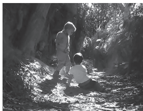
Ilustración 4. Xogo de rol en que os infantés toman o papel de cachorros e os adultos de dinosauros.