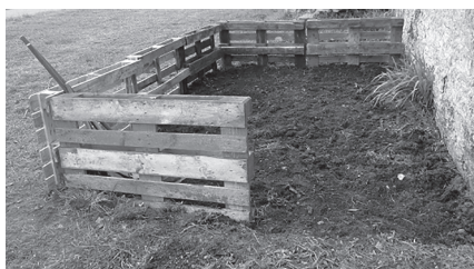
Ilustración 7. Horto escolar.

A organización temporal é variable, pois as actividades non están fixadas, senón que se valoran as necesidades e os ritmos dos nenos e nenas, os ciclos da natureza... Podemos afirmar que se segue a pedagogía do caracol , ligada á importancia de retardar os ritmos na ensinanza e, por tanto, de modificar a organización escolar. 69 Tamén hai unhas rutinas estables vinculadas cos coidados da hixiene, a alimentación e o descanso. Están no exterior un 80 % da xornada.