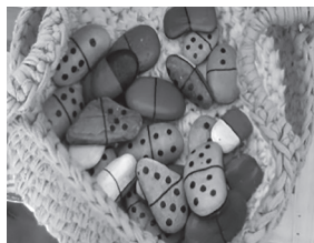
Ilustración 10. Dominó con pedras. (Fotografía de Noelia Díaz Portillo).