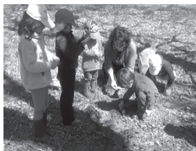
Ilustración 8. As pequenas e pequenos plasman follas con masa e realizan pegadas.