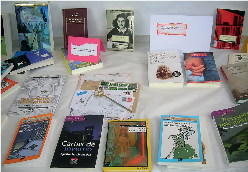
Fig.5.- A súa fertilidade literaria foi extraordinaria. Aquí, unha pequena mostra. E aínda acaban de editarse agora dous orixinais seus.