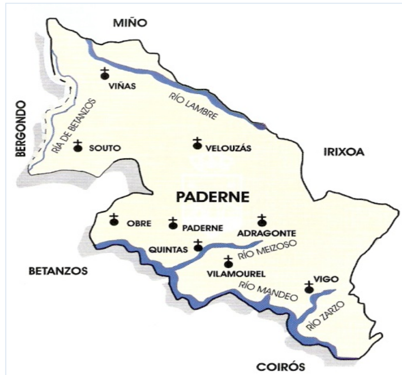
Imagen 1. Área de investigación