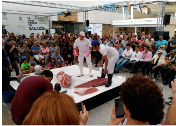
Imagen 6. Ronqueo del atún en las Jornadas Gastronómicas Mi Mar Menor de Salazón

de los artes y sistemas de pesca tradicionales del Mar Menor, así como una visita guiada en barco a las mismas (Imagen 6).