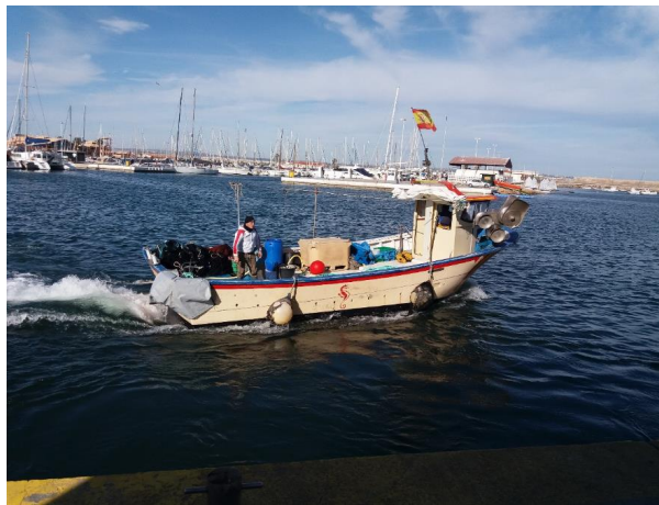
Imagen 4. Embarcación de artes menores saliendo de puerto en San Pedro del Pinatar