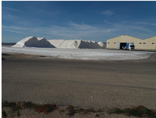
Imagen 5. Explotación salinera en el Parque Regional Salinas y Arenales de San Pedro