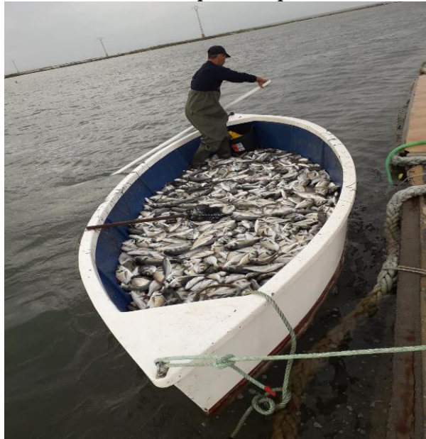
Imagen 3. Pescador con el barco lleno de pescado procedente de las encañizadas