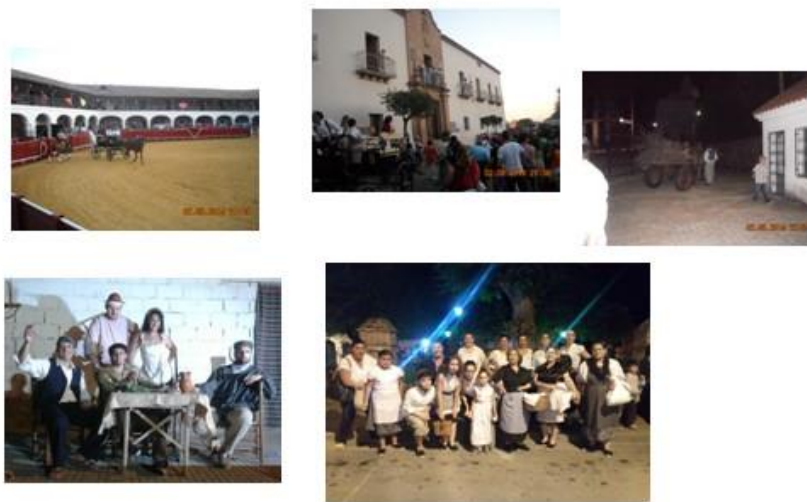
Imagen 2. Momentos de las Rutas Nocturnas “Patrimonio del mercurio”

Su realización está impregnada por la participación colectiva desinteresada, motivo por el cual se ha rechazado por parte de la Asociación la propuesta de la administración local de ser municipalizada. Y el objetivo principal que persigue no es otro que explicar el origen e importancia de los edificios históricos a la propia sociedad, como un método para implicarla en la protección de su propio patrimonio material. Pero éste no sería completo si no hubiera en la Asociación una intención de implicar a la infancia y juventud local en todo este proceso. Los asistentes a las Rutas se pueden sorprender del alto porcentaje de actores/vecinos de corta edad que participan en las mismas. Es una buena manera de consolidar las bases del mantenimiento de esta actividad cultural para un futuro, y en asegurar un conocimiento local profundo que permita valorar los elementos patrimoniales.