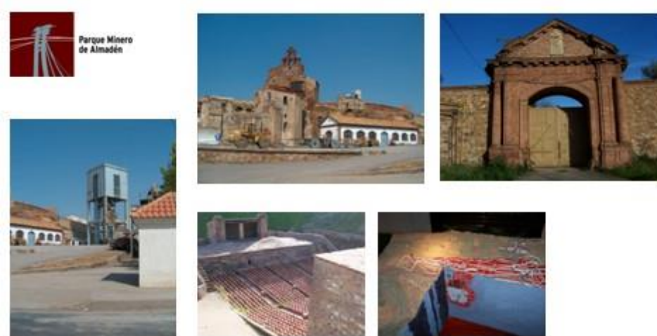
Imagen 1.- Parque Minero de Almadén

Se completa la visita en el Real Hospital de Mineros de San Rafael donde se ubica el Museo del Minero, centrado en explicar las enfermedades que sufrían los trabajadores de las instalaciones, haciendo especial referencia al hidrargirismo. A modo de contextualización hay una sala dedicada a la evolución que la metalurgia del mercurio sufrió en las Minas de Almadén.