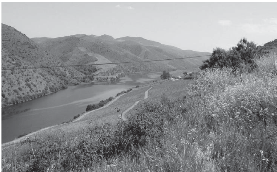
Figura 5-Vale do Côa

Se nas vertentes agricultadas já referimos que o predomínio da vinha é avassalador, a cotas mais elevadas, locais que já podemos enquadrar no Douro sub-planáltico, em vertentes de maior declive, existe uma ocupação florestal e de mato sub-atlântico em porções descontínuas e que em determinadas épocas do ano sobressaem pelo seu forte colorido. Destacam-se em Maio os tufos amarelos das giestas. Entre os fundos de vale, de feição tipicamente mediterrânea e a região planáltica existe um domínio fito-geográfico de transição. O seu carácter intermédio permite a coexistência de um estrato arbóreo em que se conjugam espécies como o carvalho roble ( Quercus Robur L. ), o sobreiro ( Quercus Suber L. ), o pinheiro bravo ( Pinus Pinaster Aiton ) e no estrato arbustivo, as já citadas giestas, os tojos ( Ulex Spp. ) o medronheiro ( Arbustus Wedo L. ), o estêvão ( Cistus Populifolius L. ), etc.