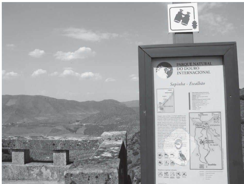
Figura 4- Barca de Alva

Ao sairmos do “Douro granítico” e entrarmos no “Douro do xisto” rapidamente nos apercebemos desta mudança. Na foz do Rio Águeda, em Barca de Alva, o horizonte expande-se. Surgem pequenas porções, de declive suave, onde se cultiva a vinha, a oliveira ou a amendoeira. Em outros locais as vinhas tendem a ocupar terrenos que, pela sua natureza rochosa e em declive acentuado, exigiram um intenso trabalho de preparação do solo e a sua sustentação. Na literatura são frequentes as alusões à dura tarefa que consistiu no erguer dos tradicionais socalcos e na implantação da vinha. Alguns autores chegam mesmo a apelidá-la, de forma alegórica, “uma autêntica labuta de gigantes”; «E resolveram meter o picão às fragas; reduzi-las a terrunha; amparar os seus “veios” estreitos com “socalcos” de pedra solta; e plantar sobre as escarpas, que eram sarças de fogo, os primeiros bacelos de videira» (Cortesão in Andrade, 1990: 19). A vinha, graças à fisiologia das suas raízes que procuram em profundidade nutrientes e água, adapta-se ao solo criado pelo homem após a realização da surribo. Do lado de lá da fronteira, ainda que se trate igualmente de uma paisagem vinhateira, o carácter arcaico ainda é mais acentuado, diferindo, no entanto de forma substancial na topografia (terreno plano onde se inserem pequenas parcelas, rodeadas de muros).