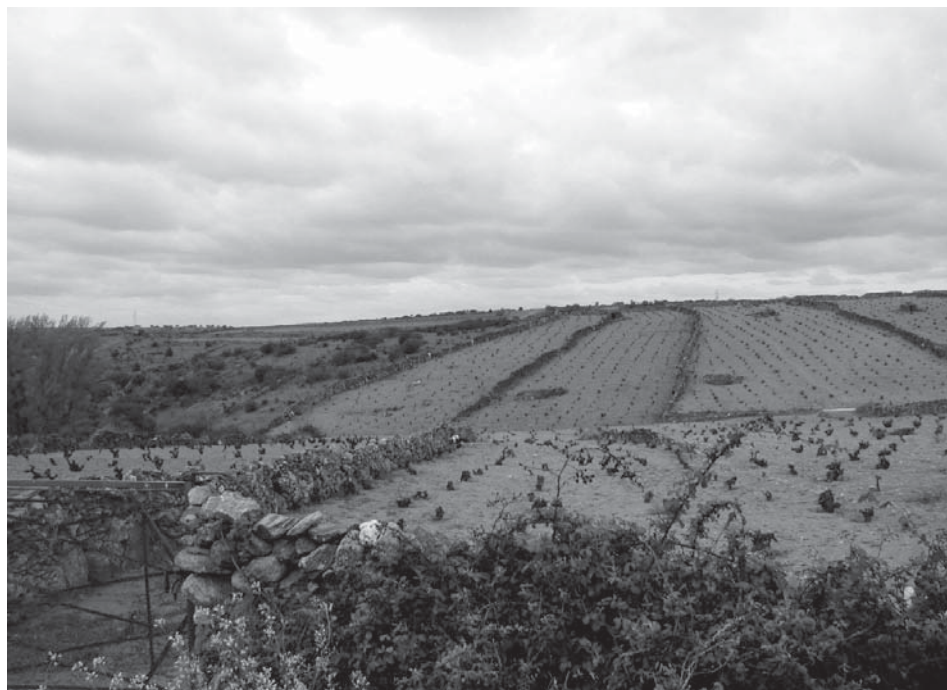
Figura 3 – Vinhas das “Arribes”

Uma das iniciativas mais recentes de nível territorial veio reconhecer o particular valor ambiental do troço internacional do Rio Douro, local de nidificação de numerosas espécies da avifauna (Zona Especial de Protecção de Aves - o Grifo (“ Gypsfulvus ”), a cegonha negra (“ Ciconianigra ”), a águia de Bonelli (“ Hieraaetusfasciatus ”)) e igualmente local de refúgio para espécies de animais em risco, nomeadamente o lobo (“ Canis lupus ”) e o gato-bravo ( Félix silvestris ”). Esta área está incluída em dois Parques Naturais: Parque do Douro Internacional, no caso de Portugal, Parque das Arribas do Douro, no caso de Espanha.