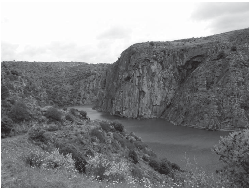
Figura 2. Escarpas do Douro Internacional

A aridez e rudeza da paisagem resultam igualmente de uma gradação climática. Os baixos índices pluviométricos conferem ao clima características marcadamente mediterrâneas, atingindo-se valores de precipitação anual semelhantes aos que se verificam no interior alentejano ou no Algarve (da ordem dos 400 a 500 mm de precipitação, em média, ao longo do ano, chegando mesmo a valores inferiores a 400 mm em determinados locais mais abrigados). Para encontrarmos índices de aridez um pouco mais ténues, com Invernos mais frios e não tão secos, semelhantes ao interior Castelhano-Leonês, temos de nos afastar das zonas mais abrigadas dos vales e de nos aproximar das serranias vizinhas.