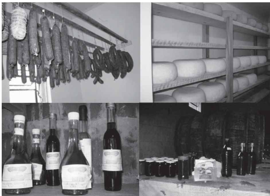
Figura 3 - Produtos comercializados no município de Silveira Martins – Rio Grande do Sul, Brasil.

As observações de Schlüter (2003) vão ao encontro do fenômeno estudado, já que os produtos comercializados no âmbito do turismo no município de Silveira Martins têm suas matérias primas em sua grande maioria oriundas do Município ou municípios vizinhos. Dados relativos a origem dos produtos comercializados na Rota Gastronômica a qual o município de Silveira Martins faz parte, podem ser observados na Tabela 1.