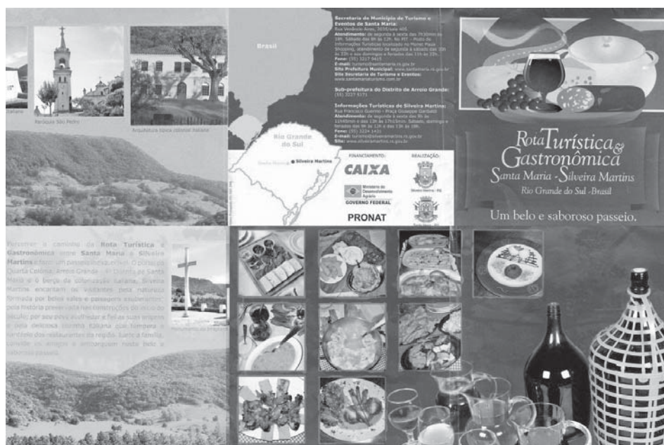
Figura 2 Folder de divulgação da Rota Turística e Gastronômica Santa Maria – Silveira Martins

Os produtos comercializados na Rota são produtos que sofrem a influência da cultura trazida pelos descendentes de imigrantes italianos (Figura 3). Isso demonstra que estes produtos possuem uma grande carga das tradições da comunidade local, já que se trata de uma área que foi colonizada por essa etnia e até hoje sofre as influências desta colonização. Entre essas influências, ainda existe o apego às práticas produtivas tradicionais, fazendo com que sejam uma expressão dos costumes tradicionais da região e também uma manifestação das ruralidades.