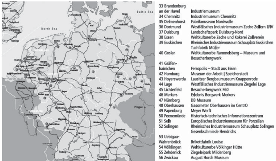
Figura 1. Mapa de los puntos de anclaje de la Ruta Europea del Patrimonio Industrial en Alemania