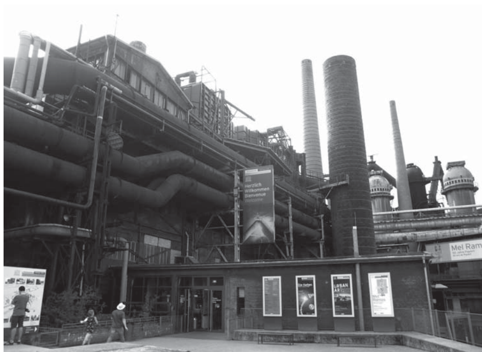
Figura 2. Exterior de la fábrica siderúrgica de Völklingen

XXI. Seguidamente se accede al antiguo almacén de minerales con una superficie de 1.000m 2 y que hoy en día sirve como sala de exposiciones. En este edificio se encuentra el Laboratorio de Ideas ( Das Ideenlaboratorium® ) ideado para ejercer como espacio para la reflexión sobre el futuro de la región de Sarre y que es parte de su estrategia de innovación. Desde aquí se puede disfrutar de una vista panorámica de la ciudad y de la planta de Völklingen tanto de día como por la noche gracias a la iluminación de la que dispone el recinto desde el año 1999.