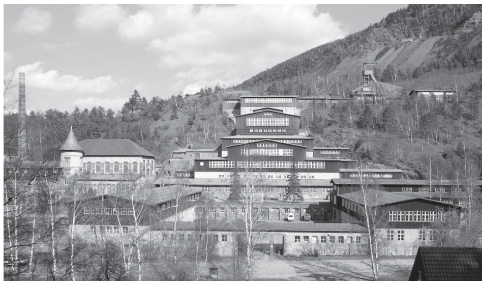
Figura 5. Exterior de la mina de Rammelsberg