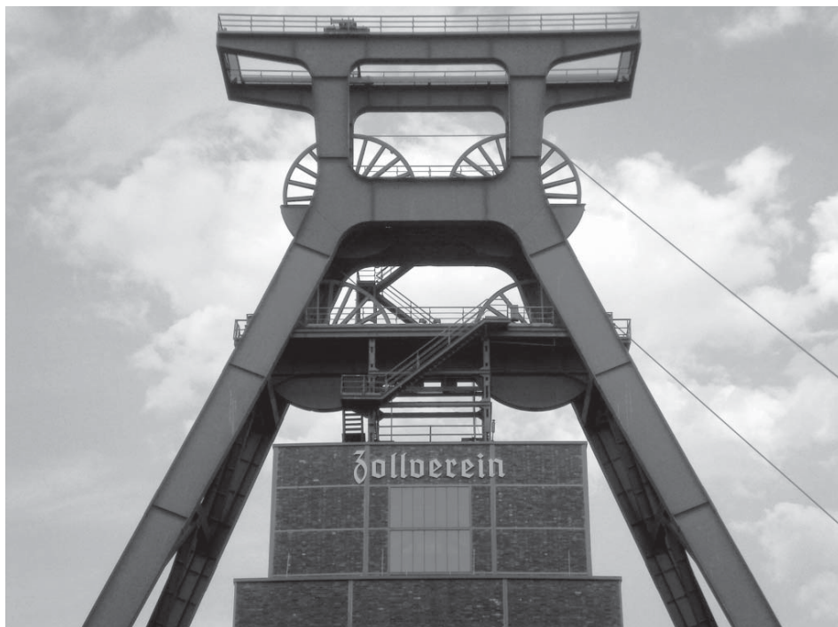
Figura 3. Castillete del pozo XII de la mina de Zollverein