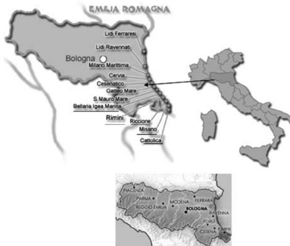
Fig. 2 – Área geográfica de intervención del “Consorzio Piccoli Alberghi di Qualità”