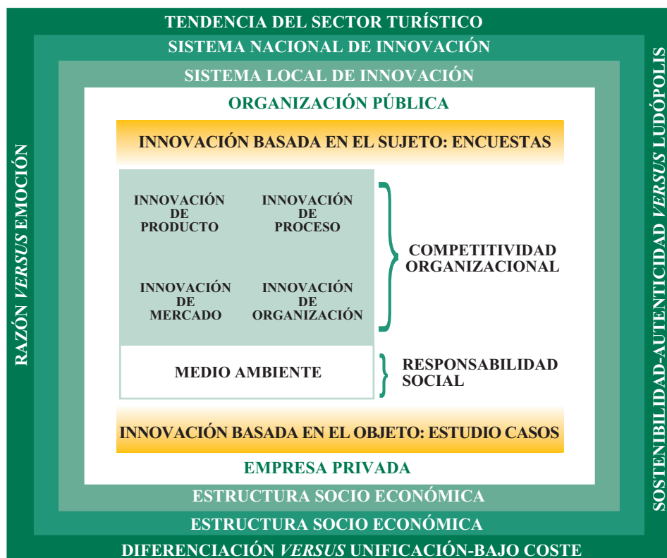
Cuadro 1. Innovaciones y contexto innovador

Para la comprensión del modelo general de nuestro análisis nos remitimos al cuadro 1, en el que se puede ver que el centro lo ocupan los distintos tipos de innovación (producto, proceso, de mercado, organizacional) que tienen como finalidad la competitividad organizacional, a la que hay que sumar en la actualidad la innovación en el medio ambiente como algo impuesto a nivel legal-social y que tiene como finalidad la responsabilidad social corporativa. Estas innovaciones pueden estudiarse tanto desde la perspectiva del sujeto como del objeto. Pueden darse tanto en las organizaciones públicas como privadas. Han de entenderse dentro de un contexto de sistema local y nacional de innovación. Al mismo tiempo en el caso del turismo es necesario entender las grandes tendencias de la innovación que están relacionadas con la razón versus emoción, diferenciación versus unificación-bajo coste, sostenibilidad-autenticidad versus ludópolis.