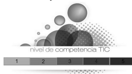
Figura 2: Niveis de competencia.

En relación con estas dimensións establécense cinco niveis de competencia TIC, que se medirán sobre a base duns indicadores para cada unha das dimensións: