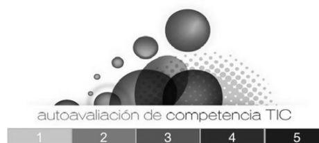
Figura 3: Cuestionario de autoavaliación.

Para poder medir o nivel de competencia TIC dispoñemos nunha aula virtual en Platega con cinco cuestionarios de autoavaliación (para facelos é necesario introducir o contrasinal "abalar" cando solicite a inscrición).