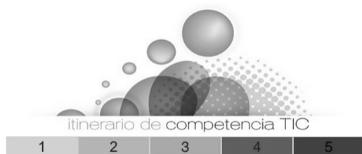
Figura 4: Itinerario Formativo

Poderán realizarse mediante a correspondente inscrición en Fprofe. Os resultados de cada cuestionario miden o nivel de competencia e sinalan a conveniencia de realizar un determinado curso dentro do itinerario formativo TIC. Esta ferramenta de autoavaliación pretende facilitar ao profesorado un coñecemento o máis aproximado posible da formación que necesita para unha mellor integración das TIC na docencia.