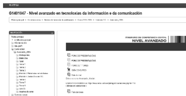
Figura 6: Curso de Nivel Avanzado