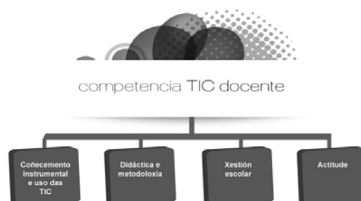
Figura 1: Dimensións

No proceso de integración das TIC no sistema educativo galego detéctase a necesidade de proporcionar ao profesorado instrumentos de valoración para coñecer a propia competencia TIC docente e poder elixir dentro da oferta formativa aquelas actividades que mellor respondan ás súas necesidades. Esta motivación leva á Consellería de Educación e Ordenación Universitaria a establecer un marco de referencia baseado en catro dimensións: