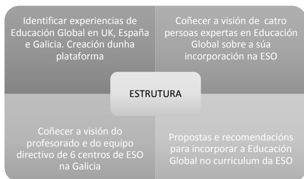
Gráfico 1. Partes da investigación

Esta investigación está estruturada en catro partes ben diferenciadas (Gráfico 1):