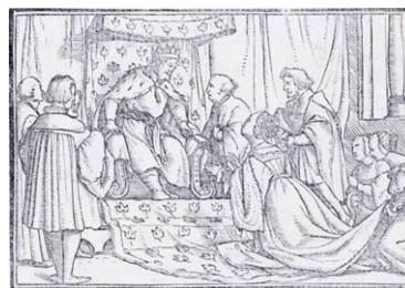
Fig. 6. Retratos o tablas de las historias del Testamento Viejo , Lyon, 1543

Gabriel Giolito envuelve el texto ariostesco con nuevos y ricos materiales paratextuales, entre ellos los resúmenes de los cantos y las breves alegorías de Ludovico Dolce que le confieren un significado moral (Cerrai, 2001: 101). En la edición de 1542, el poema se enriquece también con un nuevo programa iconográfico que, frente al de otras ediciones anteriores, presta más atención a la materia poética y muestra una nueva conciencia de la complejidad estructural del poema. Así como en los grabados de la edición del Orlando furioso de Zoppino (1530, 1536) se fija o inmortaliza un momento, una instantánea de la historia, en cada una de las xilografías de Giolito se presenta una imagen plurinarrativa en un reducido espacio (6,5 mm x 12 mm) que condensa la materia del canto y la fija en la mente del lector (Cerrai, 2001: 105, nota 20). Se muestra una escena múltiple constituida, en la mayoría de los casos, por no más de dos núcleos episódicos distintos dispuestos en varios planos, asignando el primero al episodio que, a juicio del ilustrador, resulta más importante en el interior del canto. Como en tantas otras ocasiones, también en esta se desconoce la identidad del artista o artistas de estos grabados 33 .