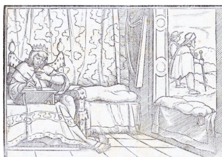
Fig. 2. Retratos o tablas de las historias del Testamento Viejo , Lyon, 1543

La estampa aparece encuadrada entre una cita latina (“David spiritu Dei afflatus, beatitudines vir describit. Impiorum quoque & infidelium interitum praedicit”, Psalm, I) y una quintilla que destaca esta imagen del rey escritor autor de los Salmos: “David con la gracia y don / De Dios describe y advierte / Los bienes del buen varón, / Y también la maldición / De los malos y su muerte” (h. K3r.). Holbein lo representa ensimismado en la escritura en la soledad y quietud de una cámara renacentista, ricamente adornada con una cortina al fondo y cojines en el alféizar, con el arpa colgada en la pared. Sentado en un rico sillón, compone en la mesa los Salmos, al primero de los cuales (“Bienaventurado es el hombre que no anda en el consejo de los impíos ni se detiene en el camino de los pecadores”)