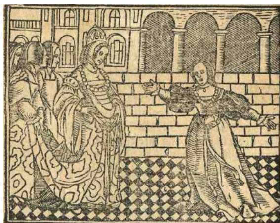
Fig. 10. Cárcel de amor , Zaragoza, 1551