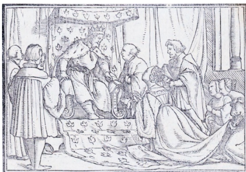
Fig. 6. Retratos o tablas de las historias del Testamento Viejo , Lyon, 1543

De los Retratos copia fielmente el grabado que ilustra el libro I y II de Esther, en concreto el momento en el que el rey Asuero repudia a Vasthi por desobediente al no comparecer en el banquete a su requerimiento y elige a Esther como nueva esposa, momento que inmortaliza la quintilla: “El rey Assuero mostrando / Su grande gloria y poder / Un combite celebrando / A Vasthi muger dexando / Escoge de nuevo a Ester” (h. K1v.) (fig. 6).