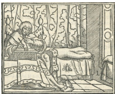
Fig. 1. Cárcel de amor , Zaragoza, 1551

El grabado elegido para representar a Leriano escribiendo (fig. 1) es, como ya se ha dicho, el del rey David componiendo los Salmos (fig. 2), procedente de los Retratos o tablas de las historias del Testamento Viejo .