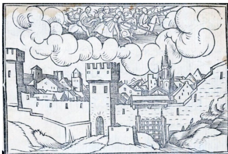
Fig. 4. Retratos o tablas de las historias del Testamento Viejo, Lyon, 1543