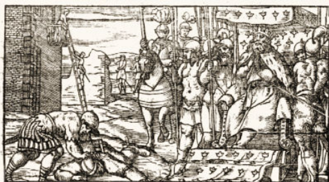
Fig. 17. Orlando furioso , Venecia, Gabriel Giolito, 1542

para la canonización editorial del poema, presentándolo como un nuevo clásico o como un clásico moderno 32 .