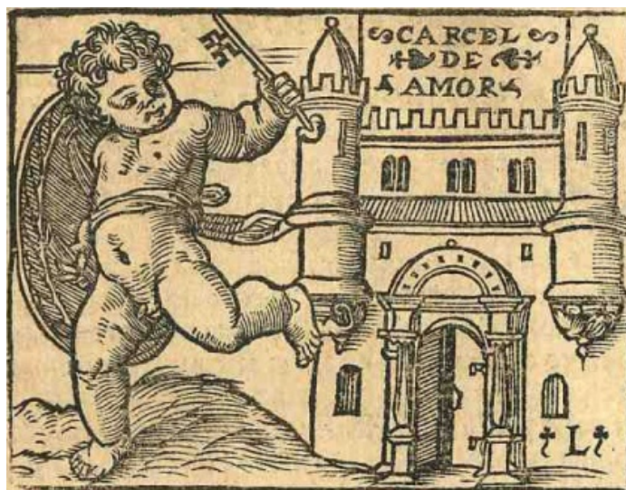
Fig. 14. Cárcel de amor , 1551

título, pero con evidentes modificaciones. Como en los casos anteriores, el grabado (fig. 14) no es original y resulta de la copia y unión de dos estampas diferentes inspiradas en las obras antes comentadas. El grabador funde en una sola xilografía un grabado de los Retratos y otro de Les images de la Mort . De los Retratos toma la estampa que representa la visión del nuevo templo de Jerusalén según la descripción del profeta Ezequiel (fig. 16), precedida de una cita latina del libro de Ezequiel, capítulo XL (“Ezechieli prophetae futura restauratio civitatis & templi in visionibus ostenditur”) y seguida de una cuarteta que dice: “A Ezechiel demostrado / Fue en visión muy claramente / Que el templo ya derrocado / Sería bien restaurado / Y la ciudad juntamente” (h. L3r.). Si en el texto bíblico se describe con detalle el nuevo templo, sus alturas en codos, puertas, dependencias y adornos, en el grabado se presenta solo la fachada. El monogramista L por su parte ha copiado solamente la parte central del grabado originario, la correspondiente a la puerta oriental del templo contemplado en su visión y ha sustituido la inscripción de la cartela central por la de “Cárcel de amor”, equivalente a la filacteria que identifica el edificio y da título al libro en las ediciones incunables (fig. 11).