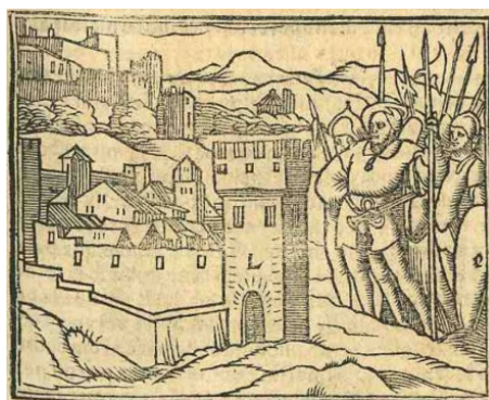
Fig. 3. Cárcel de amor , Zaragoza, 1551

Tras un grabado (modelo 2, caballero y dama dialogando) todavía no identificado, pero sin relación con las series holbeinianas, encontramos otra xilografía que representa a unos caballeros a las puertas de una ciudad (fig. 3). El grabadito resulta de la unión de dos xilografías de los Retratos (fig. 4 y fig. 5).