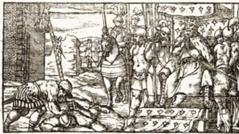
Fig. 17. Orlando furioso , Venecia, Gabriel Giolito, 1542

este caso numerado como canto IV) y posteriormente en Lyon, en 1550, en las de Guillaume Roville. En este canto orlandiano se narra cómo, durante su viaje a Escocia, Rinaldo (Renaldos) conoce, a través de Dalinda, los amores secretos entre la princesa Ginebra y el caballero Ariodante y las tentativas del celoso duque Polineso de separarlos con engaño.