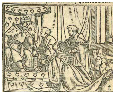
Fig. 7. Cárcel de amor , Zaragoza, 1551

Holbein presenta al rey de Persia sentado en un trono adornado con un sembrado de motivos vegetales que se han identificado con lirios o con la flor de lis, emblema heráldico de la monarquía francesa (Woltmann 1869: 28), aunque también muy utilizado como tema ornamental en la Europa occidental (Pastoureau, 2006: 118). La misma decoración aparece en otras obras de Holbein, por ejemplo, en el trono del rey sentado a la mesa en la Danza de la Muerte , en la “Cólera de Roboam”, recreada en el fresco que adorna una de las paredes de la Grossratsaal del ayuntamiento de Basilea (Salvini/Werner Grohn, 1972: 91-92, fig. 30j) o en la pintura, un poco posterior (c. 1535 y 1540), del rey Enrique VIII recibiendo, cual Salomón, a la Reina de Saba ( Collection of His Majesty the King en el Castillo de Windsor).