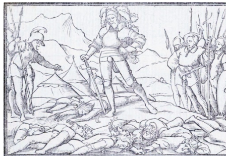
Fig. 5. Retratos o tablas de las historias del Testamento Viejo, Lyon, 1543