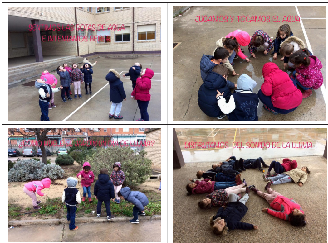
Figura 2. Educación sensorial en un día de lluvia.