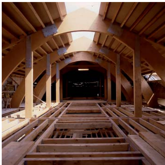
Fig. 04. José Ignacio Linazasoro Rodríguez. Intervención en el convento de Santa Teresa, San Sebastián (Guipúzcoa), 1988-91.

lar templo castellano —curiosa síntesis de Vignola y Herrera— se había visto dañado por el terremoto de Lisboa de 1755 y, tras un progresivo deterioro, había colapsado en 1977 durante unas obras de restauración. El encargo consistía en reconstruirlo para destinarlo a uso cultural como sala de conciertos y exposiciones, ahora convertido en museo de la Semana Santa (Fig. 01).