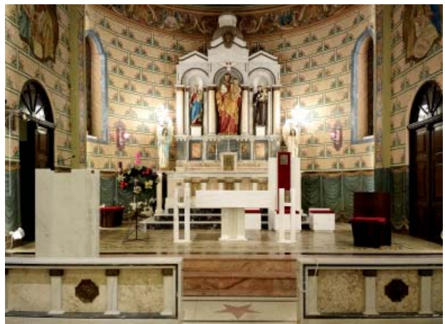
Fig. 03. Igreja matriz de San José, São José dos Pinhais (Brasil), 1905-20. Fig. 04. Igreja matriz de San José, São José dos Pinhais (Brasil), 2007; tras su elevación a catedral. Fig. 05. Igreja matriz de San José, São José dos Pinhais (Brasil), 2010; con el mobiliario definitivo tras su elevación a catedral.