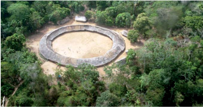
Fig. 02. Indios yanomami, Shabono , Venezuela/Brasil, 2016.

para reunirse y celebrar festividades, expresiones culturales y también religiosidad. Externamente, está el lugar donde se cultiva el alimento y las salidas a los caminos del caza y los cultivos más distantes.