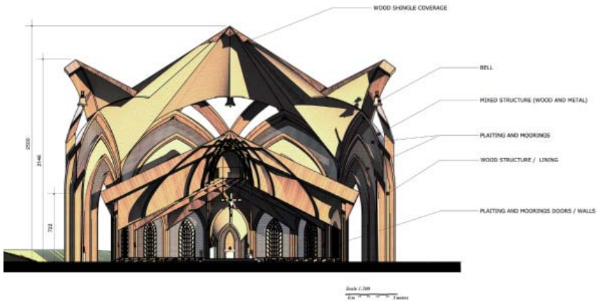
Fig. 15. Interior.