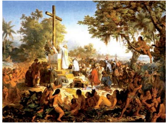
Fig. 01. Víctor Meirelles, La primera misa en Brasil , óleo sobre tela, París, 1860.

Contemporánea de esta intensa producción arquitectónica brasileña en el siglo XX, la Iglesia católica promulgó durante el Concilio Vaticano II (1962-65) la Constitución Sacrosanctum Concilium , que se ocupa de la reforma litúrgica. Por tanto, era necesario repensar el espacio de culto y, en consecuencia, comenzaron