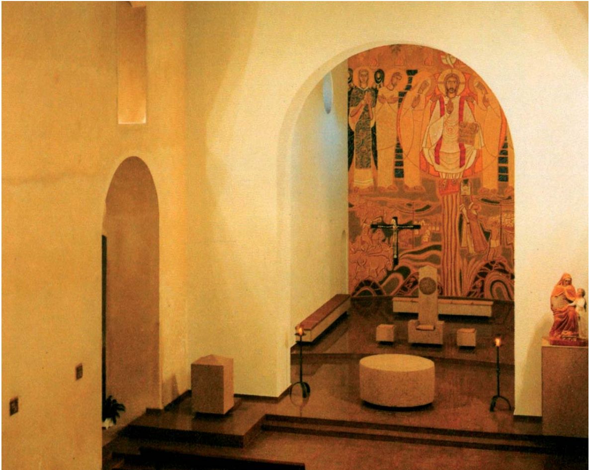
Fig. 11. Claudio Pasto, igreja matriz de Sant'Ana tras su elevación a catedral, Itapeva (Brasil), 1992.