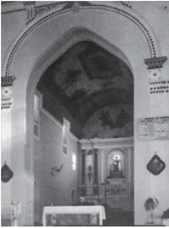
Fig. 10. Felipe de Campos Bicudo, igreja matriz de Sant'Ana, Itapeva (Brasil), 1785; con cambios (1986).