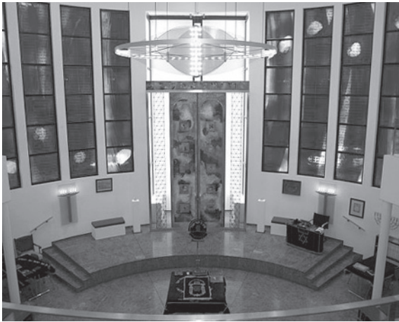
Fig. 5. Alfred Jacoby, sinagoga, Heidelberg, 1991/94.