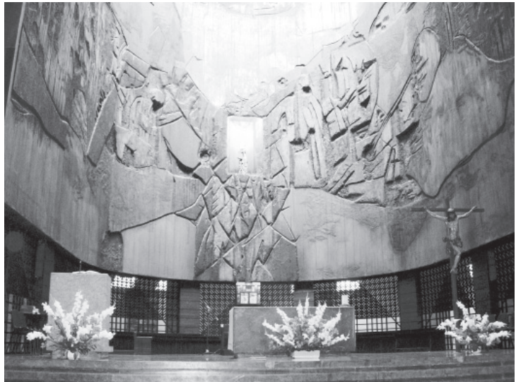
Fig. 1. Francisco Javier Sáenz de Oiza y Luis Laorga, basílica católica de Nuestra Señora de Arantzazu, Oñate, 1950/55. Interior con presbiterio, altar, ambones, lugar para la reserva eucarística, etc.