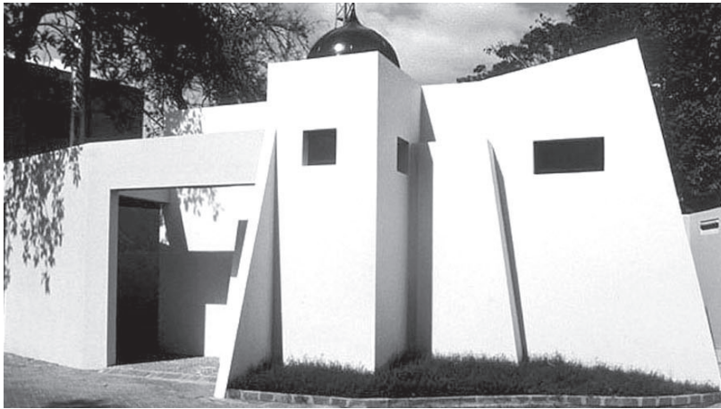
Fig. 4. Mirza Abdelkader, mezquita en la Caltex Terminal, Karachi, 1998.