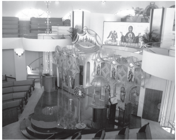
Fig. 2. Frank Lloyd Wright, iglesia ortodoxa de la Anunciación, Milwaukee, 1956/61. Interior con el santuario y el iconostasio (vista desde el segundo piso).