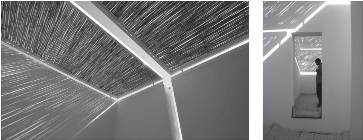
Fig. 7. Studio Tamassati, pabellón para la oración y la meditación del Cardiac Surgery Centre, Khartoum, 2008.

El Texas Children's Hospital (de la White Construction Co. of Austin for Seton Healthcare Network) abierto en 2006, tiene una capilla oval que proporciona un refugio único para que las familias, los pacientes y el personal puedan rezar, meditar, asistir a los servicios religiosos o simplemente estar en soledad con sus pensamientos. Está ubicada cerca del puente auxiliar en el tercer piso de la West Tower, directamente enfrente de las oficinas de la administración.