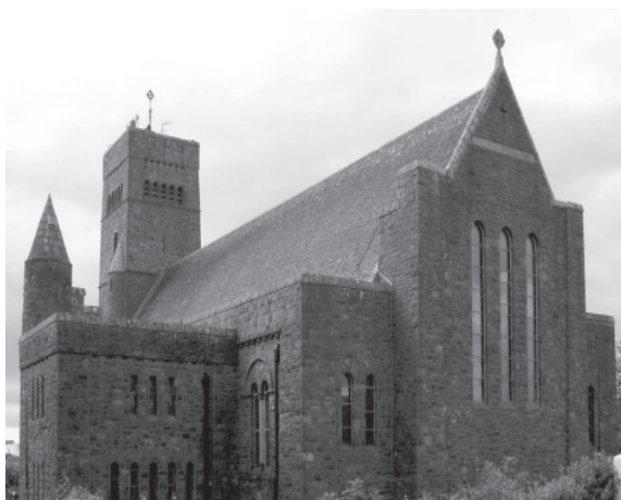
Fig. 5. Rudolf Butler, St. Patrick, Newport (1915/18)