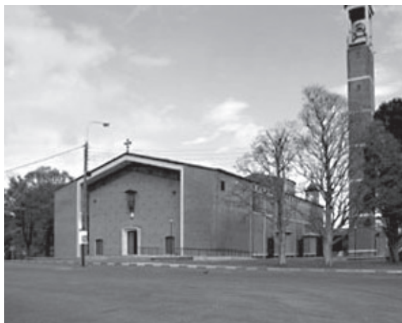
Fig. 7. Gerald McNicholl, Garrison Church of St. Brigid, Curragh Military Camp (1955/60)