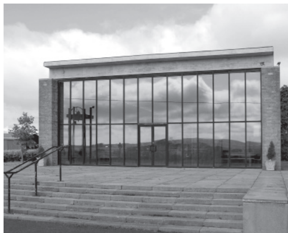
Fig. 8. Ronald Tallon, Corpus Christi, Knockanure (1964)

jambas descendentes hacia el vano oeste, incorporando también el motivo irlandés de la torre de planta circular. Butler siguió utilizando el hiberno-románico a lo largo de los años veinte en iglesias como las de Belclere (1920/25), Scotthouse (1924) y Killany (1925/31).