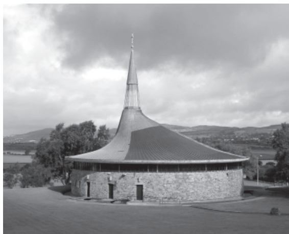
Fig. 10. Liam McCormick, St. Aengus, Burt (1964/65)

Lemass lanza el Programme for Economic Expansion, que logra relanzar la economía irlandesa. Irlanda se abre al exterior con la firma del Tratado Anglo-irlandés de Comercio (1965) e inicia las negociaciones para su adhesión al Mercado Común. El crecimiento vegetativo de la población y la disminución de la emigración estimulan la expansión de las ciudades hacia los suburbios, lo que impulsa la construcción de nuevos lugares de culto. Pese a su generalizado conservadurismo, la Iglesia Católica había estado abierta a limitados cambios en el arte litúrgico y en la arquitectura religiosa, y llega a ser un factor clave en el mecenazgo de una nueva estética a lo largo de los años sesenta, sobre todo tras el decisivo Concilio Vaticano II. El cambio se produce gradualmente, y es asumido con más facilidad por las órdenes religiosas que por el clero secular.