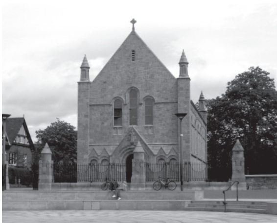
Fig. 4. James McMullen, Capilla del Honan Hostel, Cork (1915/16)