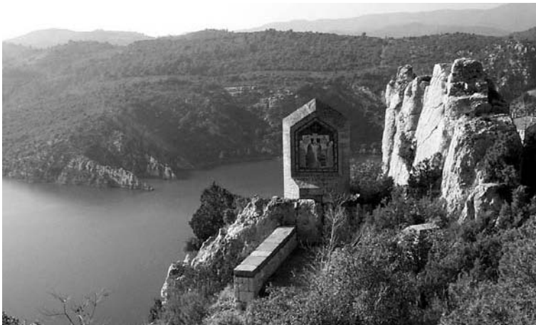
José Alzuet Aibar, Vía crucis procesional, 1985/86.

verdad se derretía en mi corazón, y con esto se inflamaba el afecto de piedad, y corrían las lágrimas, y me iba bien con ella» 26 .