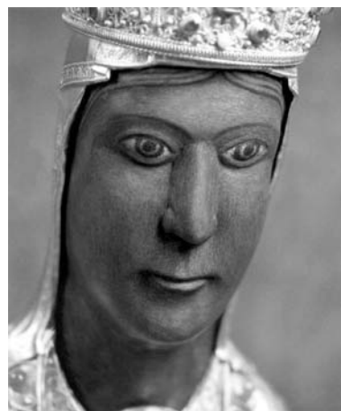
Imagen de la Virgen Negra de Torreciudad (s. XI).

https://doi.org/10.17979/aarc.2007.1.0.5030