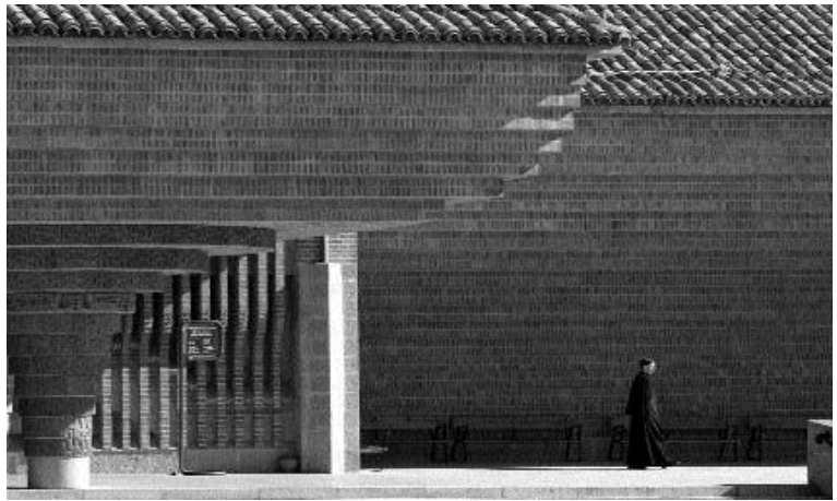
Santuario de Torreciudad. Atrio de acceso a la iglesia con las características columnas fungiformes.

The organ by Gabriel Blancafort is composed of 4.072 organ pipes plus 25 tubular bells (from G to g'). Among them, 565 belong to the choir organ and 3507 to the bigger one. Usually, the organ players accompany the Holy Mass at weekends, as well as the exhibition and blessing of the Holy Sacrament which takes place every Saturday and Sunday at 5 pm, all year round.