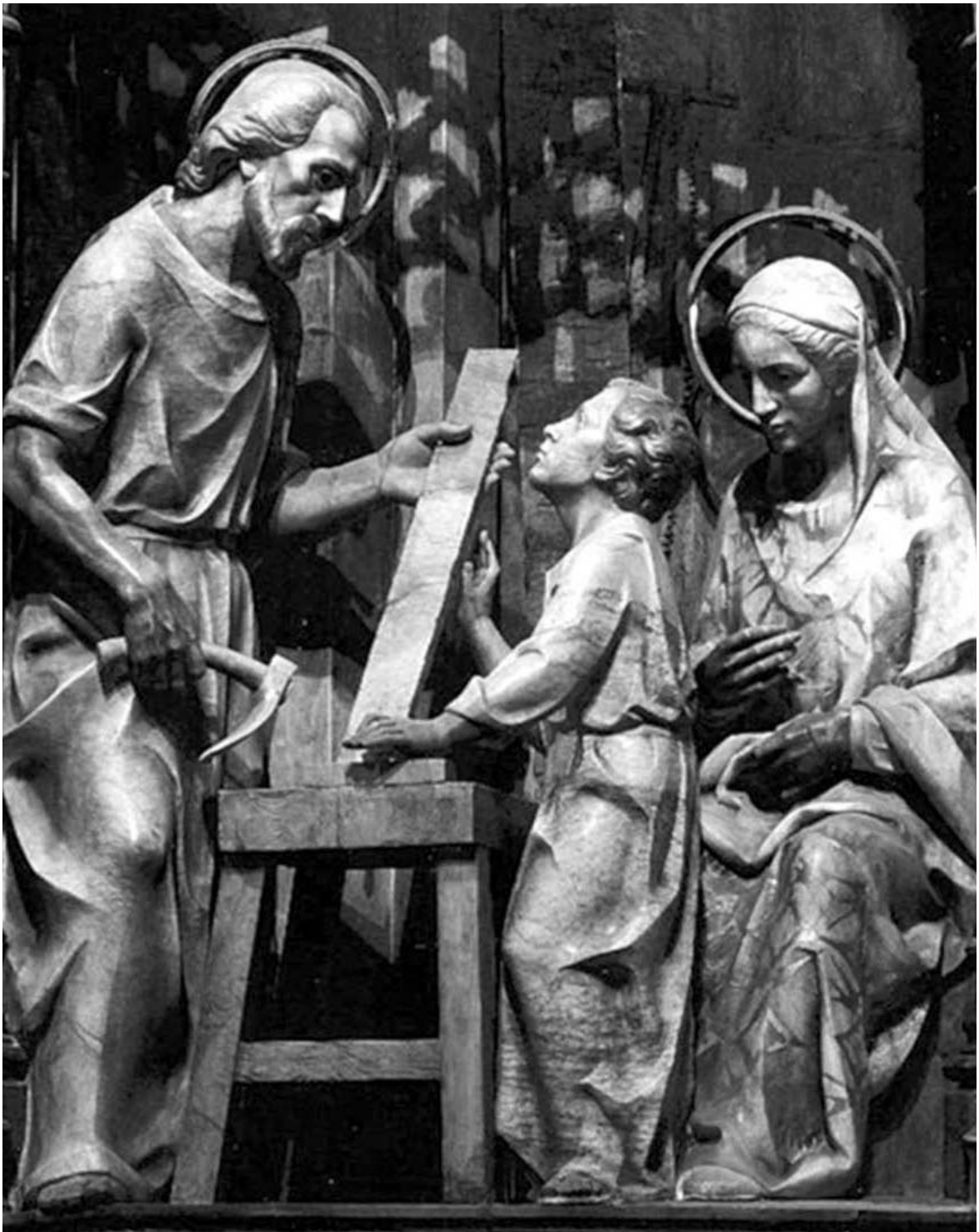
Joan Mayné i Torràs, El taller de Nazaret (detalle del retablo), 1972/75.