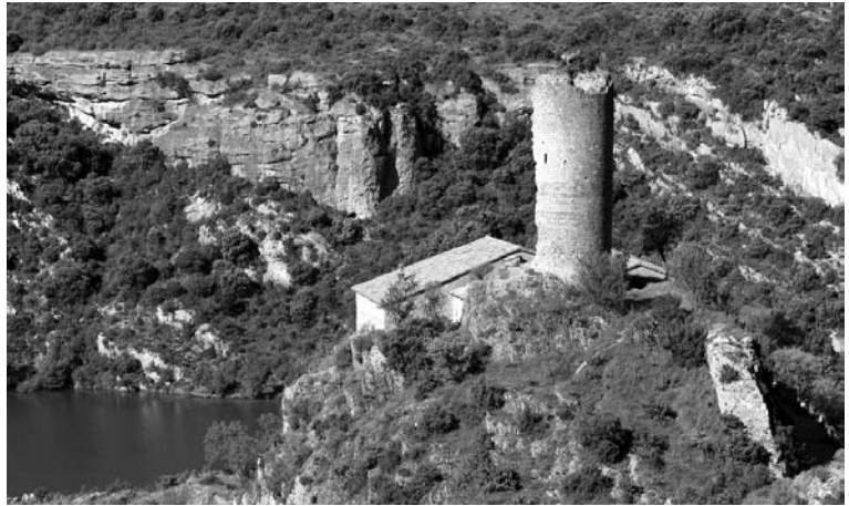
Antigua ermita de Torreciudad, con la torre defensiva.