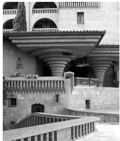
Santuario de Torreciudad. Altar al aire libre para las celebraciones litúrgicas en la explanada.