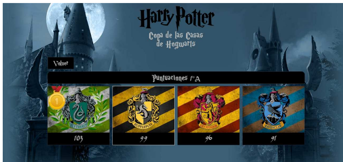
Figura 52. Resultado final de la competición Copa de las casas para uno de los grupos de 1º ESO. Elaboración propia.

Experiencias didácticas Propuesta de intervención de gamificación en educación física basada en el universo de Harry Potter. Vol. 8, n.º 1; p. 81-106, enero 2022. https://doi.org/10.17979/sportis.2022.8.1.8738