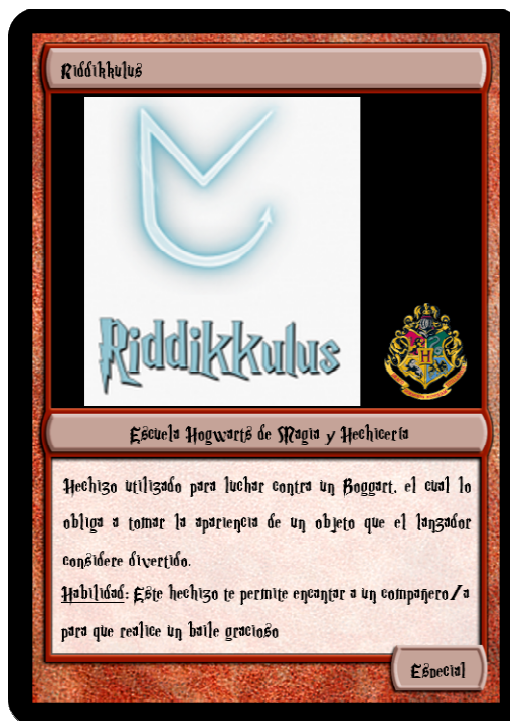
Figura 3. Ejemplo de una carta de hechizo mágico especial. Elaboración propia.