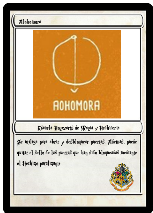
Figura 2. Ejemplo de una carta de hechizo mágico básico. Elaboración propia.

Experiencias didácticas Propuesta de intervención de gamificación en educación física basada en el universo de Harry Potter. Vol. 8, n.º 1; p. 81-106, enero 2022. https://doi.org/10.17979/sportis.2022.8.1.8738