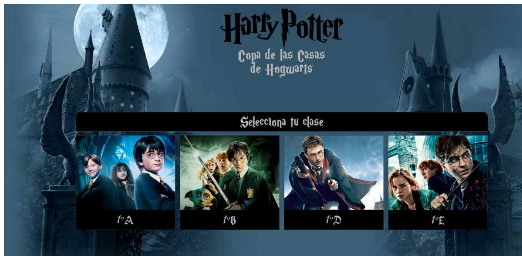
Figura 41. Display de la página web creada para proporcionar feedback al alumnado sobre la clasificación de la Copa de las Casas. Elaboración propia.

Experiencias didácticas Propuesta de intervención de gamificación en educación física basada en el universo de Harry Potter. Vol. 8, n.º 1; p. 81-106, enero 2022. https://doi.org/10.17979/sportis.2022.8.1.8738