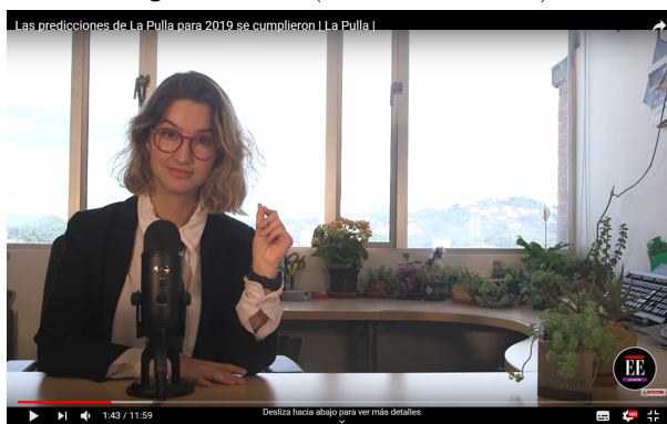
Figura 2. La Pulla

El trabajo en estudio ya no es algo tan recurrente, tanto La Pulla como La Mesa de Centro vinculan los espacios de trabajo, más familiares o urbanos con la generación de la información, para enlazar de manera más informal al espectador con los presentadores y establecer una empatía más cercana, ya que cada vez los espacios laborales son más parecidos a los familiares.