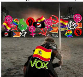
Figura 5. Visual meme donde aparece, sobre una imagen de la película “El retorno del Rey,” un guerrero, identificado con Vox y España contra todos los supuestos enemigos

La utilización de la imagen anterior de la película trajo problemas de derechos de autor.