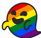
Figura 7. Imagen creado por Vox para representar al Lobby LGTBI como enemigo de España aparece en el meme basado en la imagen del Retorno del Rey. (ver figura 5).

Mención especial merece un elemento que apareció en uno de los memes más famosos de los realizados por Vox. Se trata de la representación de un pequeño fantasma con la bandera arco iris que quería representar el lobby LGTBI de forma clara. Podríamos concluir que la idea era tan buena que fue adoptada como símbolo por los propios miembros de estos colectivos. Es curioso que el colectivo LGTBI español estaba falto de una mascota o símbolo que de forma gráfica y visual fuera reconocida por toda la sociedad y más curioso si cabe es que se la haya creado (y gratis) un rival político.