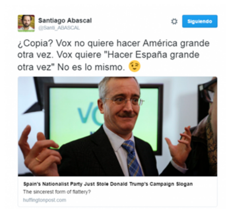
Figura 3. Tuit de Santiago Abascal negando que se hubiera copiado el eslogan de Trump.

Otro elemento importante para fijar posturas en una sola frase, han sido frases a modo de eslogan que han calado entre simpatizantes y enemigos. Así “la derecha cobarde” lanzada por Abascal, llegó incluso a indignar a un icono de la derecha española como José María Aznar (RTVE, 2019).