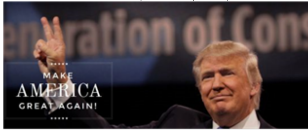
Figura 2. Campaña de Donald Trump que le llevó a la Casa Blanca en las elecciones de 2016 en la que pedía el voto para hacer grande a América otra vez.

El propio líder de Vox salió al paso de las acusaciones en twitter, para en un tono irónico y socarrón negar que fuera una copia al diferenciar entre América y España (ver figura 3). Sin duda fue otra estrategia, de con poco dinero, alcanzar notoriedad y repercusión en todo tipo de medios, fueran o no de la misma tendencia política en su línea editorial.