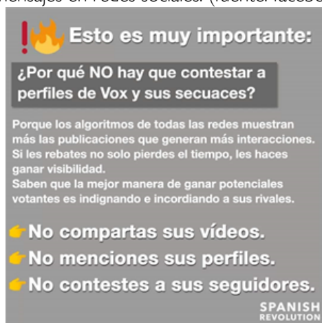
Figura 1. Ejemplo donde se puede apreciar cómo se indican desde Spanish revolution una serie de indicaciones para restar eficacia a las medidas de Vox en la difusión de sus mensajes en redes sociales.

En estas elecciones, convocadas para el 28 de abril de 2019 la formación verde puso de nuevo en marcha su estrategia de comunicación, que tan buenos resultados le había dado unos meses antes. Pero en este caso el factor sorpresa ya no existía y se encontraron con contramedidas (ver figura 1), que si bien pudieron en algún caso restar algo de difusión, no pudieron evitar que, comunicacionalmente hablando, Vox se convirtiera en el protagonista de la elecciones que se produjeron en España en abril y mayo de 2019.