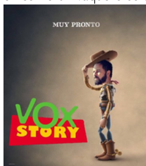
Figura 4. Meme que presenta a Santiago Abascal como Woody, en una película de dibujos animados, pero también como un vaquero sólo ante el peligro. (fuente: Vox)

La producción de estos mensajes gráficos de fácil lectura y comprensión, cargados de humor irónico en muchos de los casos, ha tenido dos líneas. Una propia dentro de la misma organización que los creaba y lanzaba con medios propios y otra que eran los propios militantes y simpatizantes, que con recursos propios, ideaban y realizaban sus memes que enviaban a la organización para su difusión a través de sus canales, mucho más poderosos que los que podrían tener un elemento particular. En este caso la organización tan sólo se limitaba a dar publicidad a los memes más adecuados sirviendo de filtro para evitar mensajes contraproducentes o demasiado salvajes y poco entendibles para el público en general.