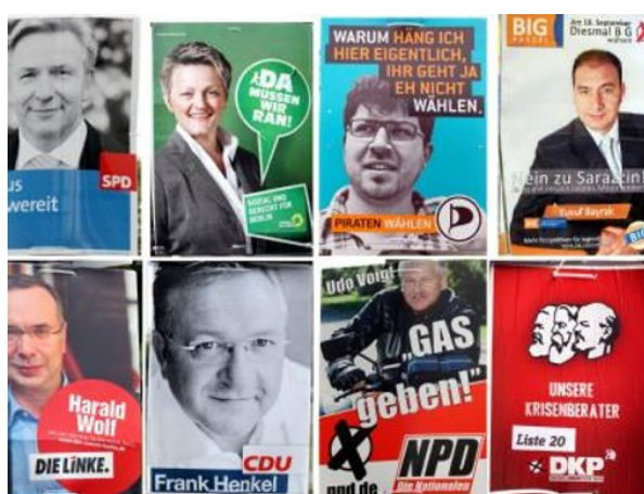
Figura 1: Carteles electorales en las elecciones al Parlamento de Berlín

Así, el partido comenzó con su abordaje institucional para el que no necesitaron pata de palo o parche negro en el ojo. He aquí una de las estrategias de la que se sacó provecho de manera directa e indirecta: el publicity . Por un lado con sus acciones en la calle de las que dieron buena cuenta los medios de comunicación que comenzaron a hablar de la formación a raíz de las primeras encuestas de intención de voto. Como mencionamos más arriba, no es menos cierto que los grandes partidos tampoco hicieron campañas excesivamente destacadas. En el siguiente gráfico podemos ver la cartelería de los principales aspirantes al gobierno de Berlín.