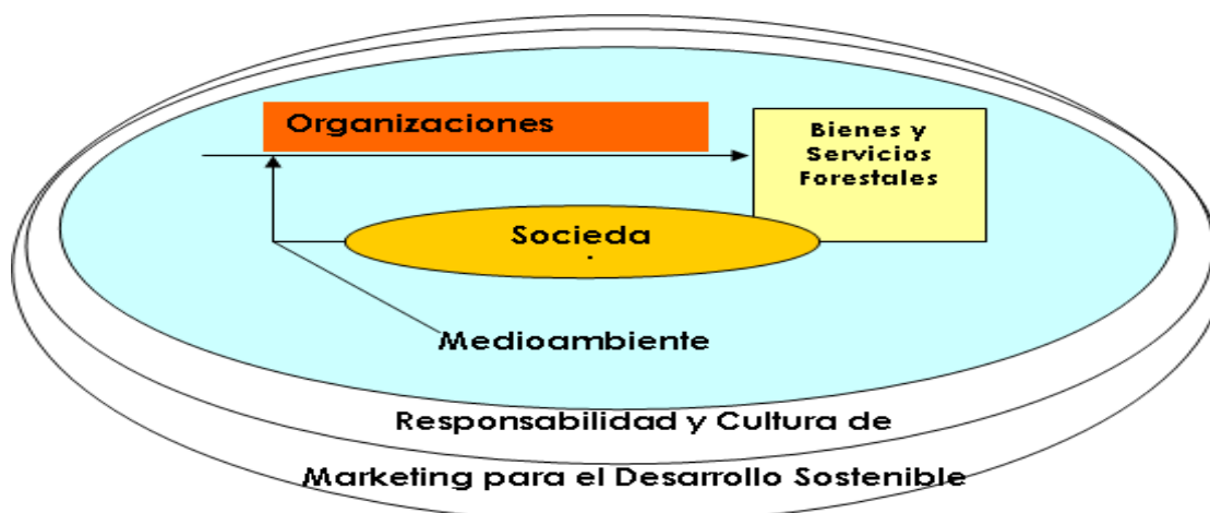
Figura. 1. Principio básico del marketing para el desarrollo sostenible.

“En la sociedad moderna, la producción y el consumo marchan por separado. El marketing los pone en contacto. Desde un punto de vista social, el marketing es una filosofía que muestra cómo crear sistemas eficaces de producción y, consiguientemente, cómo crear prosperidad. Los negocios son un subsistema de la sociedad, que cumple a la vez un papel económico y social. [Por lo tanto, una empresa debe operar de modo que haga posible producir beneficios para la sociedad y al mismo tiempo producir beneficios para la propia organización]. (Braidot, 1996)