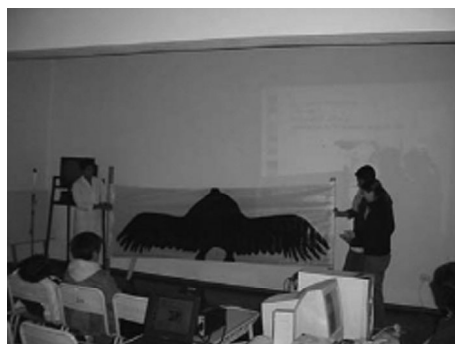
Foto 3. Involucrando aos nenos na proposta: Realización de Campañas educativas nas escolas. Participaron aproximadamente 1000 alumnos pertencentes a 14 escolas da rexión