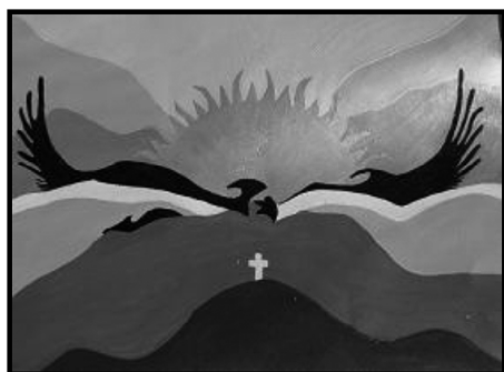
Ilustración 3. Escudo da Dirección de Turismo da localidade de 28 de Novembro.

Esta liberación foi moi significativa, xa que foi precedida dunha cerimonia que contou coa presenza de numerosos habitantes da conca e cun representante da comunidade mapuche, quen levou adiante a mesma, reflectindo así a iniciativa de revalorizar aos pobos orixenarios da rexión (Foto 5).