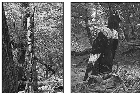
Foto 1. Fomento das actividades recreativo-turísticas: Esculturas do Sendeiro "Bosque dos Trasgos", realizadas por artesáns da rexión patagónica mediante a utilización de árbores mortas en pé.

Paralelamente, desenvolveuse unha campaña de educación ambiental denominada " Os cóndores da conca, unha reserva