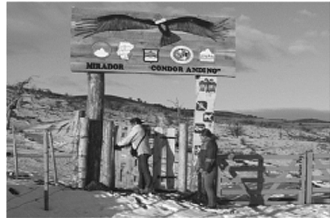
Foto 4 e 5. Inauguración do Carreiro “Miradoiro do Cóndor” na localidade de 28 de Novembro (Santa Cruz) e portal de ingreso