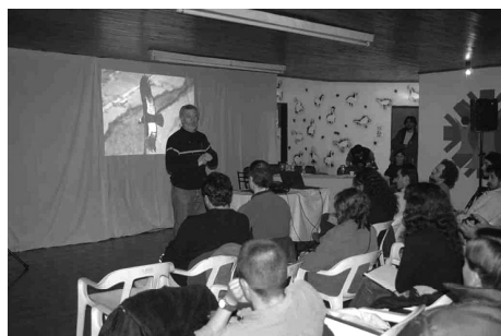
Foto 2. Fortalecemento das capacidades locais: Cursos de Capacitación, a partir dos cales habilitáronse “Guías de Sitio” nas localidades de Río Turbio e 28 de Novembro

Un factor importante foi a utilización dos medios de difusión masivos. Desde o inicio do proxecto divulgáronse as diferentes actividades realizadas, participando en diver-