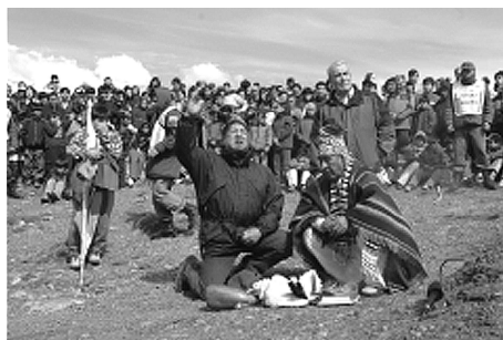
Foto 5. Cerimonia de liberación dun cóndor por representantes dos pobos orixenarios, na localidade de Río Turbio (Santa Cruz). Ano 2005

A Cuenca Carbonífera conta cun enorme potencial de recursos naturais e sociocul-