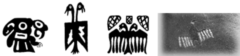
Ilustración 1: Representacións pictóricas do Cóndor Andino nas civilizacións pre-hispánicas

É un ave estritamente carroñera, posúe unha das taxas reprodutivas máis baixas do mundo e unha das maiores taxas de supervivencia entre as aves (LAMBERTUCCI, 2008). Segundo o seu estado de conservación, está catalogada como rara (GRIGERA e ÚBEDA, 1997) e Próxima á ameaza (BIRDLIFE