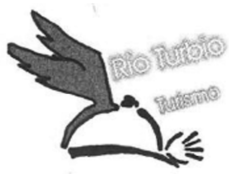
Ilustración 2. Escudo da Dirección de Turismo da localidade de Río Turbio