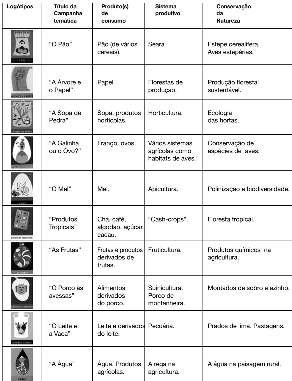
Quadro 1. Estrutura das dez campanhas temáticas do projecto