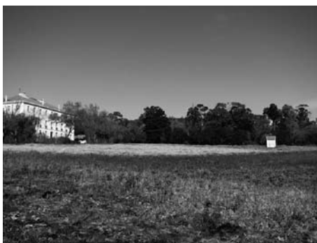
Foto 2. Espaços agrícolas

O manancial florístico e faunístico presente na Tapada proporciona às actividades educativas um excelente laboratório vivo, passível de ser explorado com diferentes públicos. Este recurso associa-se à investigação científica do CEABN e do ISA, que garante a actualização dos conhecimentos bem como a assessoria técnica de especialistas na área, e à participação dos alunos universitários, que trabalham no projecto como educadores/monitores ambientais. Este conjunto de factores reúne todos os ingredientes necessários para se realizar um trabalho que se pretende com qualidade.