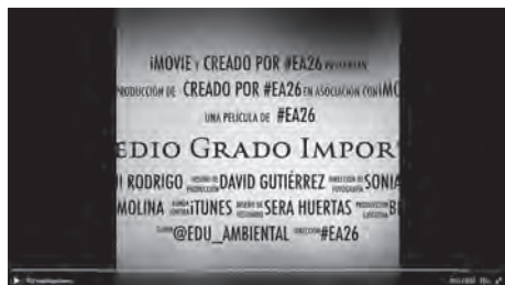
Ilustración 3: Vídeo da ciberacción “Fronte ao cambio climático, máis educación ambiental” .