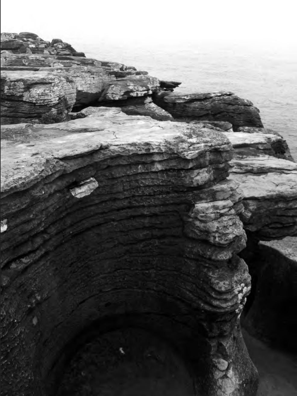
Rede Natura do Oeste. Cabo Carvoeiro-Peniche (Portugal)