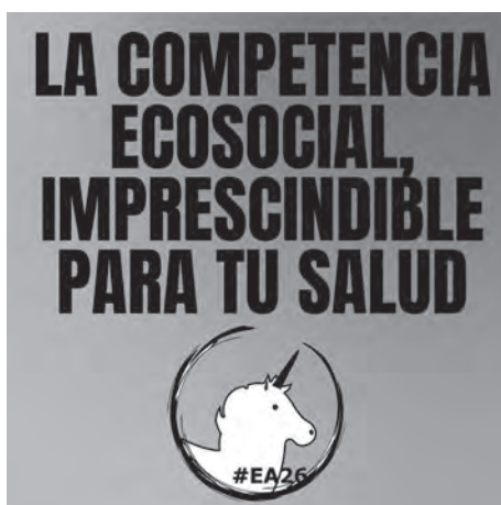
Ilustración 8: Campaña para introducir a competencia ecosocial no sistema educativo.

O alumnado, a través da competencia ecosocial, é consciente dos límites ecolóxicos e é capaz de actuar dentro deles e de axustar a súa actividade ao funcionamento dos ecosistemas. Tamén facilita a reflexión sobre as posibles transformacións persoais e colectivas e proporciona ferramentas para unha toma de decisións que permita avanzar nunha transformación social cara a sociedades xustas, democráticas, descarbonizadas e sostenibles. O seu fundamento debe ser o coñecemento científico e o desenvolvemento dun sentido crítico