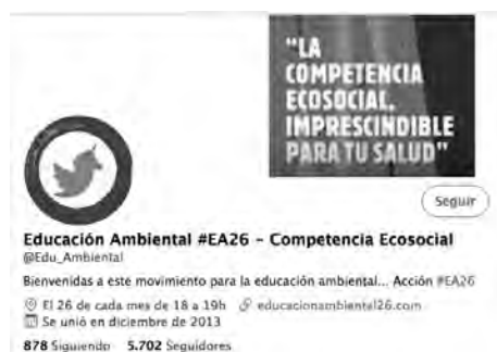
Ilustración 1: Captura de pantalla do colectivo #EA26 en twitter