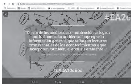
Ilustración 4: Vídeo da ciberacción “Fronte ao cambio climático, máis educación ambiental” .

Xa en 2020, a urxencia sanitaria da COVID-19 é tratada desde #EA26 como un momento delicado de reflexión e apoio mutuo. No confinamiento propónse facer un debate semanal para atoparse, sentirse cerca e compartir as reflexións relativas á crise internacional e o papel da EA neses momentos de incerteza (Ilustración 5). Á súa vez colabórase directamente coa canle de youtube “Sinapsis Ambiental”, promovido polo Centro de Documentación e Recursos para a Educación Ambiental en Cantabria-CEDREAC do Goberno de Cantabria, onde se retransmiten os debates comentados por unha persoa próxima e coñecedora de #EA26.