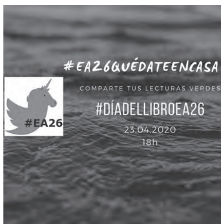
Ilustración 5: Pantallazo dunha actividade de #EA26_QuédateEnCasa.