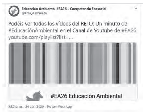
Ilustración 6: Pantallazo de Twitter informando do canle de Youtube #EA26.

Iníciase cun primeiro contacto a través de Twitter onde se intercambian tweets coa Ministra de Transición Ecolóxica. Este encontro casual derivou na proposta de reunión no Ministerio para a seguinte semana. A través de WhatsApp , defínese o grupo de persoas que van á reunión e paralelamente en Drive vaise construíndo un documento colaborativo coas achegas do equipo de