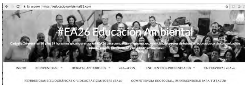
Ilustración 2: Captura de pantalla do blog do colectivo #EA26.

Desde 2014 en #EA26 houbo 58 debates os días 26 de cada mes coa etiqueta #EA26 (Táboa 1).