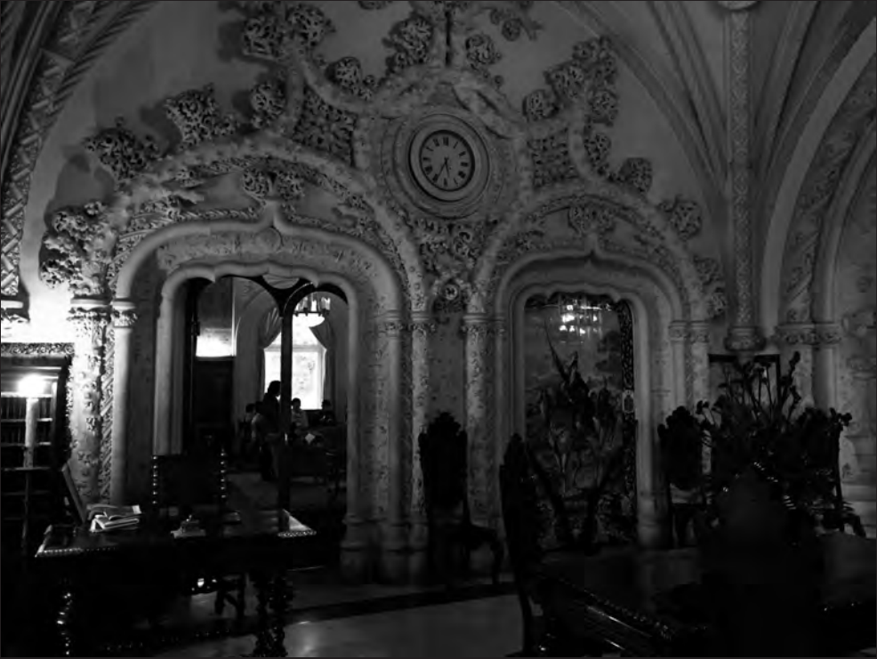
Palacio de Buçaco-Luso (Portugal)