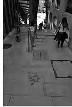
Imaxe 13. Grafitis que sinalizan o percorrido da muralla e levan ao encontro do seguinte panel.