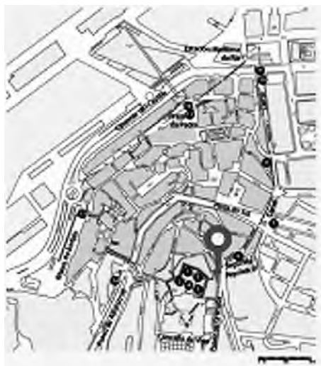
Imaxe 10. Plano guía onde se sitúan os distintos puntos interpretativos. Este plano inclúese en todos os paneis para sinalizar ao paseante en que punto se atopa da ruta e os demais que pode encontrar se a segue.