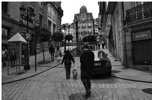
Imaxe 8: Zona Leste do trazado da muralla onde con abundante mobiliario urbano.