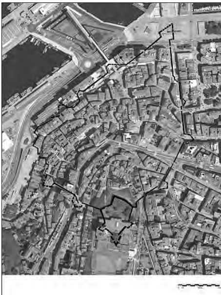
Imaxen 6: Trazado da muralla sobre a cidade actual. Proposta feita a partir da análise dos diferentes planos e dos puntos onde as escavacións descubriron alicerces.