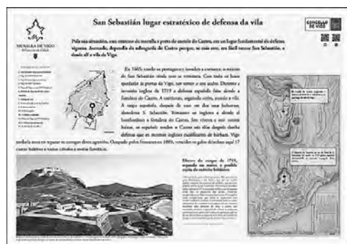
Imaxe 14: Reprodución dun panel onde se pode ver a estrutura compositiva que se describe no texto.

Cando se levantaron as defensas da cidade, San Sebastián, situado nun extremo da