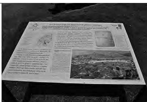
Imaxe 15. Outro panel colocado. Dado que non contábamos con imaxes o debuxos foron unha parte fundamental do traballo. Para a súa elaboración abordouse unha tarefa de documentación específica.