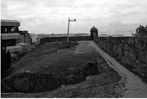
Imaxen- 2 Castelo de San Sebastián, interior onde hoxe se atopa a casa do concello, a esquerda.

de 147 m. de altura, en cuxas abas Norte e Leste se desenvolveu a cidade desde época medieval e por onde descorría a muralla. Esta fortaleza, conservada en boa parte, hoxe queda no centro urbano, facendo parte dun parque público, un lugar de paseo para a veciñanza e un punto de visita obrigado para turistas polas súas impresionantes vistas sobre a cidade e sobre a ría de Vigo, tal e como recollen as guías de visita e rutas de paseo pola cidade. No entanto, coa desaparición da muralla esqueceuse a súa memoria e o vencello co castelo do Castro.