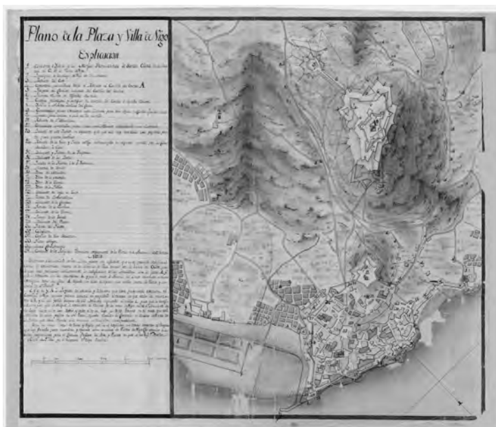
Imaxen 5: “Plano de la Plaza y villa de Vigo” de 1805

O traballo comprendía un único elemento, a muralla, polo que se obviaba a labor de inventario e selección patrimonial. Sen embargo, as súas características e circunstan-