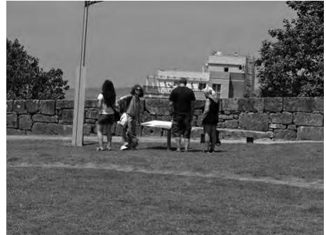
Imaxe 17 Observación do comportamento do visitante en San Sebastián

A observación do comportamento do público . Dúas sesións nos dous puntos principais do recorrido (unha semana e un mes despois de rematada a execución). No extremo Norte, A Praza da Pedra é un lugar de paso, que une o porto e un centro comercial coa cidade, onde o tráfico de persoas é constante e onde poucas se detiñan a observar os paneis. No extremo Sur, O Castelo de San Sebastián, é un área axardinada de paseo onde os visitantes se detiñan moito máis a observar os paneis, a comentalos con acompañantes, a intentar identificar no territorio o contido dos pa-