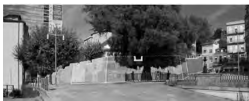
Imaxe 16. Panel que mostra outra das estratexias para suplir a falta de imaxes como é a de reconstruír a traza da muralla sobre a foto da cidade actual