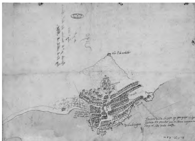
Imaxen 4. Plano da vila de Vigo datado en 1597, antes da construción da muralla (España, Ministerio de Educación Cultural e Deporte. Arquivo Xeral de Simancas. MPD16,015)

Esta corrente da arqueoloxía enmarcarse no contexto de desenrolo de moitas outras disciplinas e técnicas de tipo territorial que dende hai uns anos incorporan a dimensi-