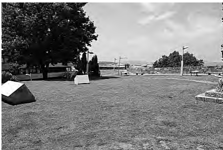
Imaxe 11. Vista xeral da situación dos murais en azulexo e paneis no Castelo de San Sebastián, e onde se aprecia parte da panorámica sobre a cidade. No fondo a esquerda o edificio municipal

Nos catro puntos restantes colocáronse 5 paneis interpretativos de diferentes momentos históricos da construción e uso da muralla.