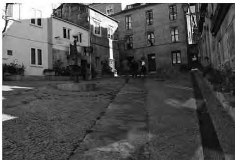
Imaxe 9: zona Oeste da traza onde se mantén un ambiente tradicional

Para a súa disposición evitáronse as áreas xa redundantes de sinais e aparellos urbanos e as que mantiñan un ambiente máis tradicional, onde pensábase que os carteis romperían a contorna tradicional que aínda conservaban.