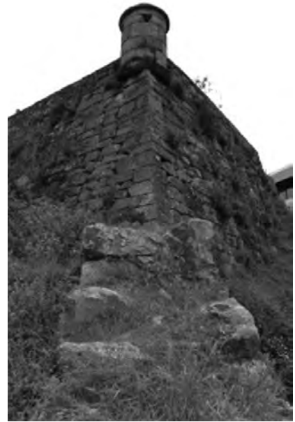
Imaxen 3 Exterior. Semibaluarte onde entronca coa pequena porción de muralla conservada

Entre a veciñanza a muralla é coñecida principalmente pola loita contra a ocupación francesa da cidade en 1809. A manobra