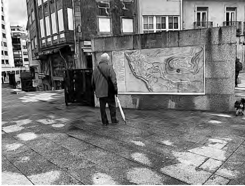
Imaxe 12. Mural en azulexo que reproduce un plano da cidade, disposto aproveitando un muro xa existente na Praza da Pedra