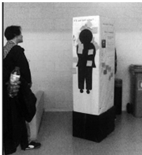
Foto 11: Módulo no que se recollen valoracións as persoas que visitan a exposición

Rematamos coas palabras de Andrew DOBSON, “en vez dunha racionalidade masculina ou feminina, PLUMWOOD aboga por unha racionalidade ecolóxica que ‘recoñeza e asuma as relacións negadas de dependencia e nos permita admitir a nosa débeda cos demais sustentadores da terra” (1990: 235).