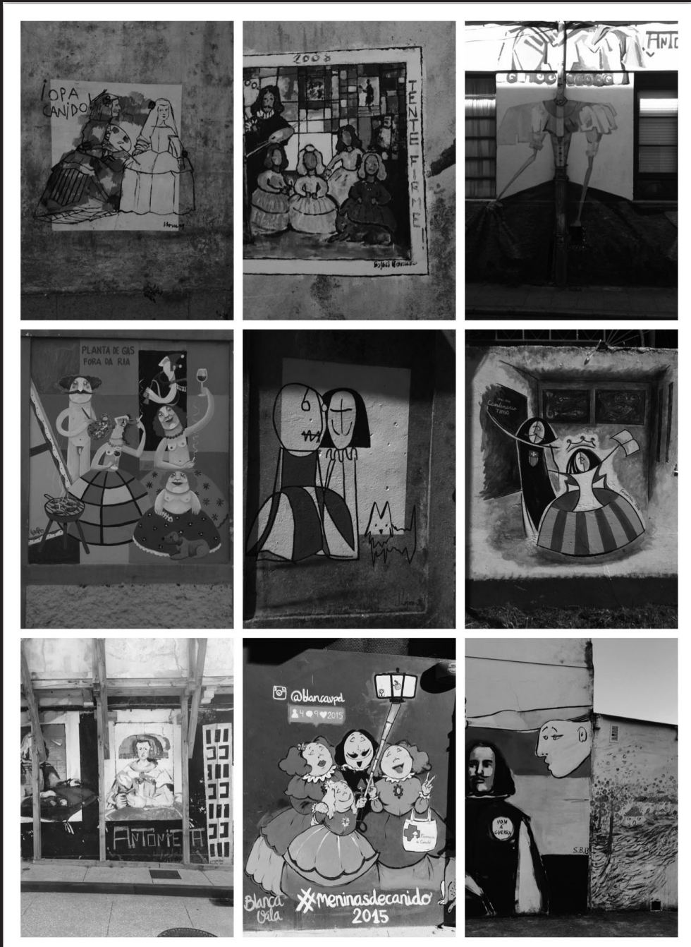
Intervención socio-artística nas rúas para denunciar o abandono do barrio de Canido (Ferrol-Galicia)