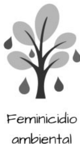
Imaxe 1: Logotipo