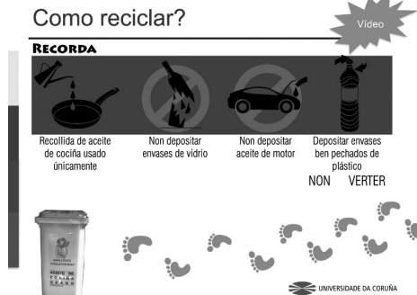
Fotografías 2 a 3: Exemplos da campaña de motivación e divulgación