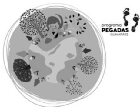
Figura 1: Programa de Educação Ambiental-PEGADAS

A Educação Ambiental é hoje assumidamente um dos pilares fundamentais de uma estratégia que vise o desenvolvimento sustentável de um território e a alteração de alguns paradigmas e comportamentos, a prova disso é a recente apresentação da Estratégia Nacional de Educação Ambiental 2020 que aponta como “ crecente a importância da atuação dos técnicos, tanto das autarquias como dos equipamentos de educação ambiental no desenvolvimento de projetos ou programas de Educação Ambiental ”, reconhecendo já a “ existência na grande maioria dos municípios de profissionais ligados aos pelouros de Ambiente e Educação com competências técnicas específicas que promovem já um conjunto de atividades nesta área ” (REPÚBLICA PORTUGUESA, 2016). Também já anteriormente a Agenda 2020, tinha estabelecido metas ambiciosas para redução de 20% de emissões de gases, incremento do uso de energias renováveis em 20%, ou mesmo redução de 20% do consumo energético, metas consubstanciadas nos programas Europa 2020 e Portugal 2020.