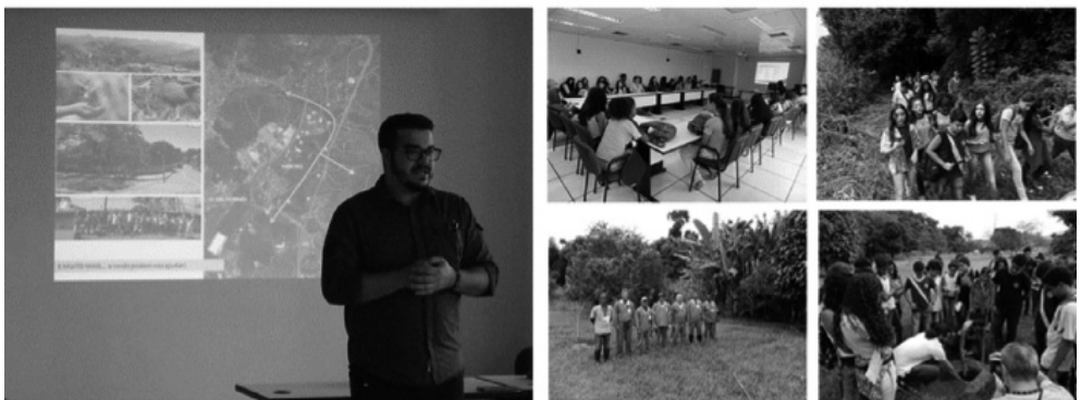
Fig 9: imagens ilustrativas do evento Dia do Meio Ambiente, em 2017, no Inmetro, a mostrar o Diretor de Administração e Finanças em fala para alunos da rede pública; na apresentação, o mapa mostra a conectividade com os remanescentes da floresta.

Deve-se aqui ter em mente o processo de sucessão ecológica da Mata Atlântica, onde as áreas livres e sem manutenção são ocupadas inicialmente e rapidamente por vegetação herbácea e arbustiva densa, sem interesse paisagístico para o senso comum. Este é um ambiente muito favorável para a regeneração de processos naturais, mas que dificulta significativamente alguns serviços de manutenção e de vigilância patrimonial. Esta paisagem alterada atrai animais silvestres, principalmente as aves que encantam as pessoas, mas também os peçonhentos, que as amedrontam. Conseguir intervir dessa maneira na paisagem não é trivial e o resultado pode ser considerado como uma pequena grande vitória.