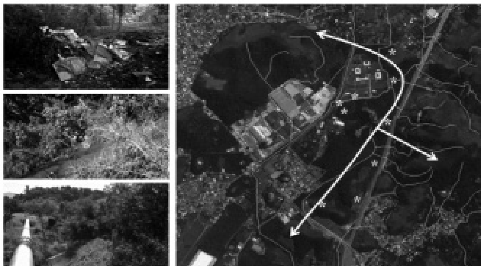
Figura 2: aspectos do Campus do Inmetro que sintetizam a preocupação da equipe de meio ambiente: resíduos em local inadequado, efluentes sem tratamento e desmatamento das margens de rio, que resultam em degradação de habitats e perda de conectividade.

de afetar a saúde humana e descumprir a legislação ambiental, tem impacto direto sobre espécies nativas, algumas endêmicas e sob ameaça. Da mesma forma, o Inmetro tem grande responsabilidade quanto a correta manutenção de suas áreas livres, o que inclui a recuperação de áreas de preservação permanente ciliares e de encosta, protegidas pela Lei de Proteção da Vegetação Nativa (BRASIL, 2012), mas em grande parte degradadas, que servem de habitat, refúgio e passagem para a fauna dispersora de sementes, necessária à sobrevivência das florestas e à manutenção de inúmeros serviços ambientais relevantes, como a produção de água, a regulação do clima local e a fixação do solo nas beiras de rio e nas encostas. A Figura 2 ilustra as preocupações da equipe de meio ambiente do Inmetro com os impac-