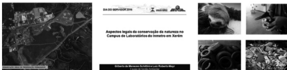
Fig 6: imagens ilustrativas da palestra realizada por ocasião do Dia do Servidor, em 2016, no Inmetro, a mostrar as áreas de preservação permanente do Campus e efeitos da antropização sobre a fauna silvestre.

Para a palestra do Dia do Rio, em 21 de novembro, não previsto no calendário oficial de comemorações, mas oportuno para essa estratégia, foi utilizado o audi-