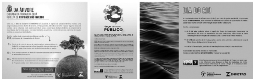
Fig 8: imagens ilustrativas do material de divulgação preparado pela equipe de comunicação do Inmetro para os eventos de Educação Ambiental de 2016; o conteúdo ligado ao objetivo na conservação está no próprio texto, mas também é destacado no box com a pergunta “você sabia?”.

Estes eventos, apesar de terem uma organização trabalhosa, no preparo das matérias de divulgação e jornalismo, na elaboração palestras, na obtenção de mudas e preparo dos plantios, na abertura e manutenção de trilhas, têm custo muito baixo. Os benefícios que podem ser obtidos no médio e longo prazo são potencialmente grandes, quando se pensa no objetivo geral ligado à conservação. A Figura 8 ilustra as campanhas realizadas pela equipe de comunicação para os eventos de Educação Ambiental em 2016.