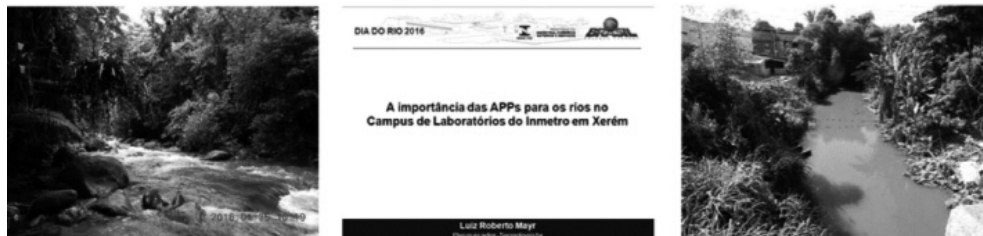
Fig 7: imagens ilustrativas da palestra realizada por ocasião do Dia do Rio, em 2016, no Inmetro, a mostrar como o rio Saracuruna e suas margens se degradam nas áreas antropizadas.

tório da Diretoria de Metrologia Científica, e teve como tema a proteção dos rios (e das águas) por meio dos serviços ambientais prestados pelas Áreas de Preservação Permanente. Mais uma vez da necessidade de recuperar as APP áreas de preservação permanente degradadas no Campus mas a enfatizar a importância de tratar adequadamente os efluentes lançados pela instituição nos corpos de água. Curiosamente, foi incluída na programação uma breve apresentação do projeto da nova estação de tratamento de efluentes, a ser construída, mas ninguém da área de Engenharia ou da Alta Administração se dispôs a comparecer. A Figura 7 ilustra a abordagem da palestra realizada, com