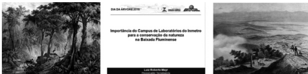
Fig 5: imagens ilustrativas da palestra realizada por ocasião do Dia da Árvore, em 2016, no Inmetro, a mostrar a Mata Atlântica em seu estado original e a paisagem degradada do Rio de Janeiro já no século XIX.

representar a Mata Atlântica em bom estado e a paisagem degradada da Baixada Fluminense, na periferia do Rio de Janeiro. É no período de D. João VI no Brasil que ocorre a primeira grande crise de abastecimento de água na capital, que irá motivar a proteção das florestas que existem ainda hoje na região onde está inserido o Campus do Inmetro.