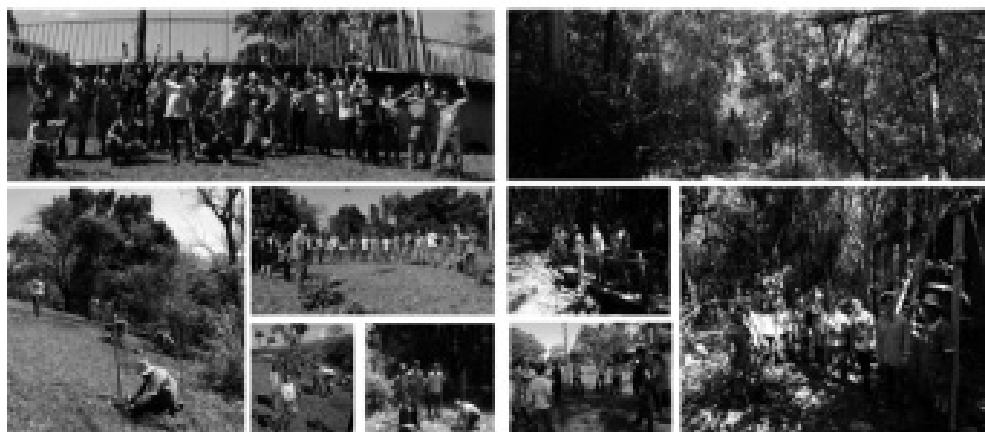
Figura 4: imagens ilustrativas de plantios e trilha pela floresta por ocasião do Dia da Árvore, em 2016, no Inmetro, com a participação de colaboradores e pessoal de manutenção de áreas externas do Campus.

Na parte da tarde foi realizada a palestra “ Importância do Campus do Inmetro para a conectividade na Baixada Fluminense ”, não somente para abordar conteúdos de Biologia da Conservação, mas para destacar o importante papel que a instituição pode desempenhar na conservação da biodiversidade e a importância dos serviços ambientais ligados à água. Para garantir um público mínimo na palestra, esta foi aberta à todos mas dirigida aos funcionários da empresa contratada que faz o serviço de manutenção de áreas externas. Com isso a palestra contou com a presença de cerca de 75 pessoas; um sucesso! A Figura 5 ilustra a abordagem da palestra realizada, com imagens do Século XIX a