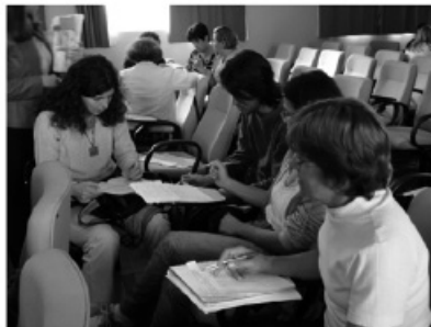
Fotos 5-6: Atividades formativas do COEDUCA, 2007-2009.