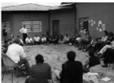
Fotos 1-4: Atividades formativas do COE-DUCA, 2007-2009.