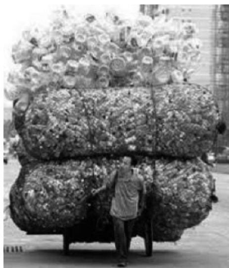
Figura 5. Imagem ilustrativa do volume de plástico gerado pelas sociedades modernas.

A partir dessas discussões, os quatro integrantes do grupo de Estágio Curricular escolheram seus temas de trabalho, desenvolveram estudos e iniciaram a produção