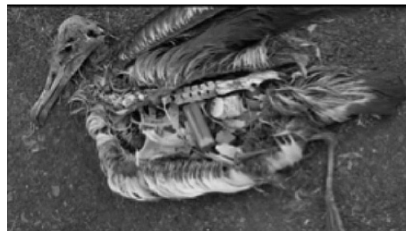
Figura 3: Imagem captada do vídeo Midway: message from the Gyre (MIDWAY, 2012).

Pode-se também trabalhar conteúdos relacionados aos tipos e volume de resíduos de uma cidade, um estado, ou país, buscar quantificá-los e caracterizá-los. Esses conhecimentos e reflexões podem também evoluir para uma discussão e estudos sobre algo que estamos chamando de ecologia do lixo, a exemplo das recentes descobertas das ilhas cobertas de plástico nos oceanos (MIDWAY, 2012; NEWER, 2014).