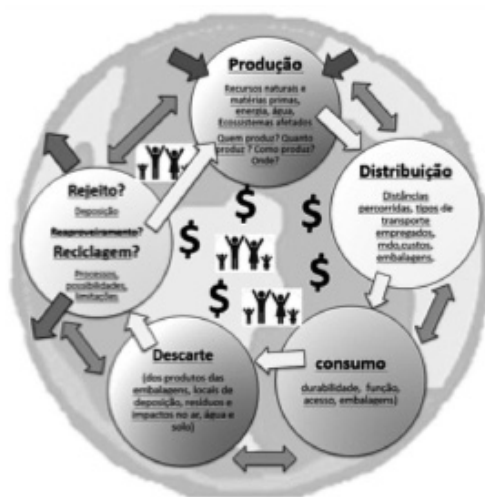
Figura 1: Fluxograma dos estudos de PCV

Inclui estudos sobre a cadeia de produção, distribuição e consumo de produtos e materiais; identificação de matérias-primas e recursos naturais empregados nos processos de produção, reaproveitamento ou reciclagem de resíduos e impactos gerados nos ecossistemas; estudos sobre uso, função e durabilidade dos produtos de consumo; bem como questões sobre geração e distribuição de renda, condições de trabalho e saúde dos consumidores e dos trabalhadores.