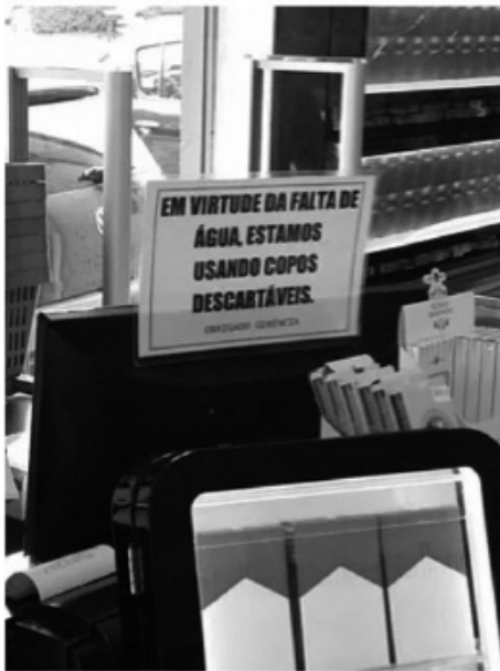
Figura 2: Foto ilustrativa do emprego de copos plásticos em bares e restaurantes em São Paulo na época da estiagem que abateu a região Sudeste do Brasil.

nos processos de fabricação, o impacto desses componentes no ambiente, seu custo-benefício, seu potencial de reaproveitamento e/ou reciclagem, como é processada a logística reversa, sua importância econômica e demais aspectos.