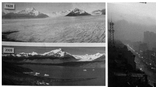
Foto 1 e 2, Gráfico 1, Ilustración 1: Exemplo de fotografías, gráficos e ilustracións utilizadas nos libros de texto en relación co CC

Respecto á comunicación visual nos libros de textos sobre o CC, e utilizando os criterios de M. Pilar PUNTER (2014:10-11) para analizar as imaxes do CC na prensa escrita, observamos que seu uso é similar, xa que logo as fotografías responden á “semántica do medo”, advirtindo das