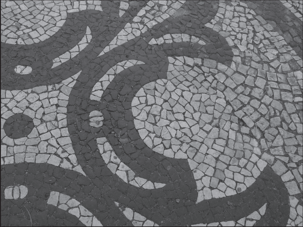
Praza do Comércio (Lisboa-Portugal)