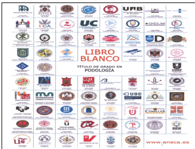
Figura 6.- Libro Blanco del Título de Grado en Podología, 2.005

El informe presentado por las nueve Universidades españolas que impartían la titulación de Diplomado en Podología, en el marco de la Segunda Convocatoria de Ayudas para el Diseño de Planes de Estudio y Títulos de Grado de la Agencia Nacional de Evaluación de la Calidad y Acreditación (ANECA), fue aprobado por la Comisión de Evaluación del diseño del título de grado y recomendó su publicación, que se hizo, con la denominación de “ Libro Blanco del título de Grado en Podología ”, en julio de 2.005 (8).