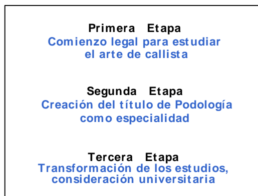
Figura 1.- Etapas de los estudios de Podología en España

El objetivo de esta clasificación es trazar un panorama general, a modo de encuadre del artículo, de la historia de los estudios de Podología referido solamente al ámbito español. Sin ánimo, ni mucho menos, de exhaustividad, la clasificación de las tres etapas se realiza con el objetivo de repasar un conjunto de acontecimientos fundamentales (1-4).