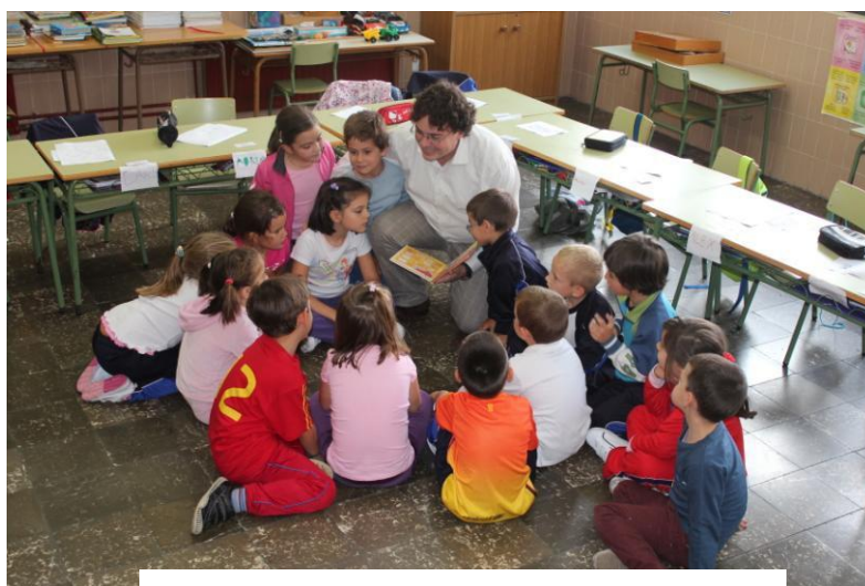
Imagen 2: Lectura en el aula

Se les pediría a los alumnos que supusiesen un contexto, que por los paisajes y