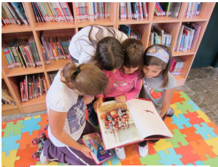
Imagen 1: Lectura en la Biblioteca

La primera girará en torno a la lectura de las dos versiones seleccionadas del cuento de Baba Yaga y la posterior comparación del tratamiento del personaje principal en ellas.