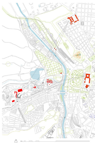
Fig. 01. Imagen de la obra Paisajes Expositivos

moral. Es el espíritu de la vida en el campo, con lo que tiene de sacrificio, disciplina y entrega, el que se quiere traer a la metrópoli y ese espíritu resulta inspirador para los arquitectos Asís Cabrero y Jaime Ruiz, que aportan a la arquitectura española edificios de insólita modernidad en los que la razón constructiva, basada en sistemas tradicionales de arcos y bóvedas de ladrillo, es la gran protagonista donde la “inherencia forma-función”, como diría Cabrero, produjo espectaculares espacios expositivos.