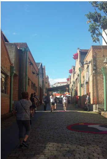
06. Lina Bo Bardi, SESC Pompéia, São Paulo (Brazil), 1977/86; view from outside.