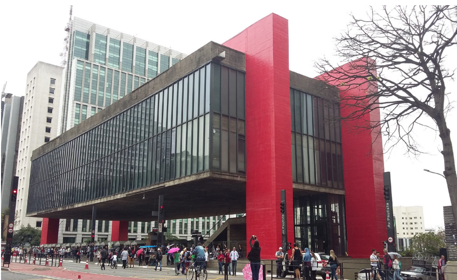
02. Lina Bo Bardi, Museo de Arte de São Paulo (MASP), São Paulo (Brasil), 1958/68; fotografia desde la Avenida Paulista.