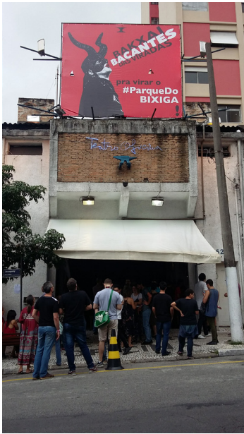
12. Lina Bo Bardi, Teatro Oficina , São Paulo (Brasil), 1980/91; vista exterior.