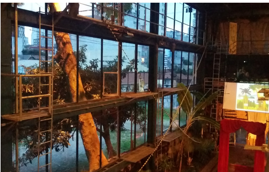
13-16. Lina Bo Bardi, Teatro Oficina, São Paulo (Brasil), 1980/91; vista interior.