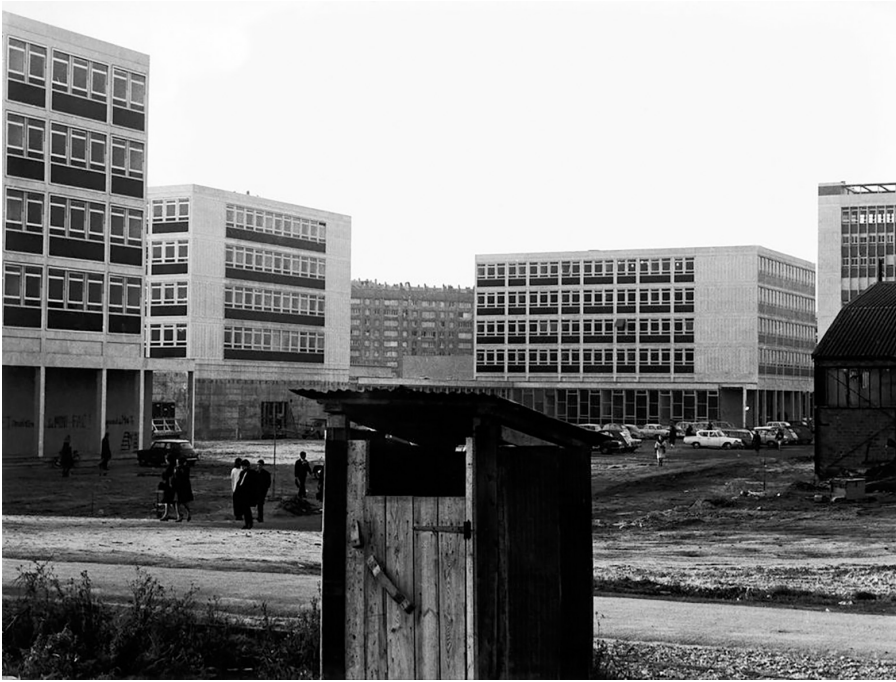
04. Imagen tomada en el nuevo Campus Universitario de Nanterre. Construido siguiendo los principios del urbanismo moderno. 1968.