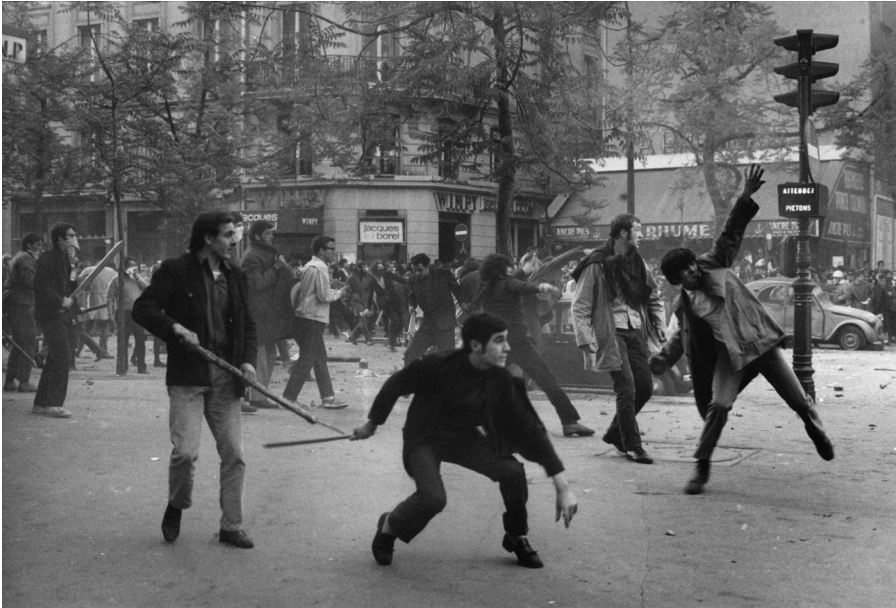
02. Mayo 1968, París. Sexto arrondissement. Boulevard Saint Germain. Estudiantes lanzando proyectiles contra la policía.