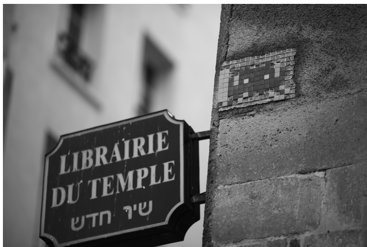
09 Yellow arrow, Washington D.C., 2007. 10 Invader, Paris, 2013.

nexiones entre ciudadanos para dar un valor distinto al espacio colectivo, incentivar el arraigo y ampliar la memoria colectiva (Fig.08).