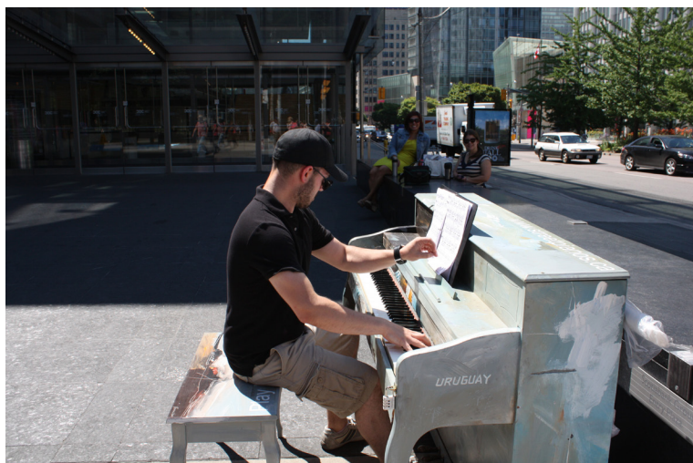
08 Playme, I'm yours. Toronto, 2012.