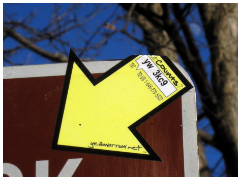
09 Yellow arrow, Washington D.C., 2007. 10 Invader, Paris, 2013.