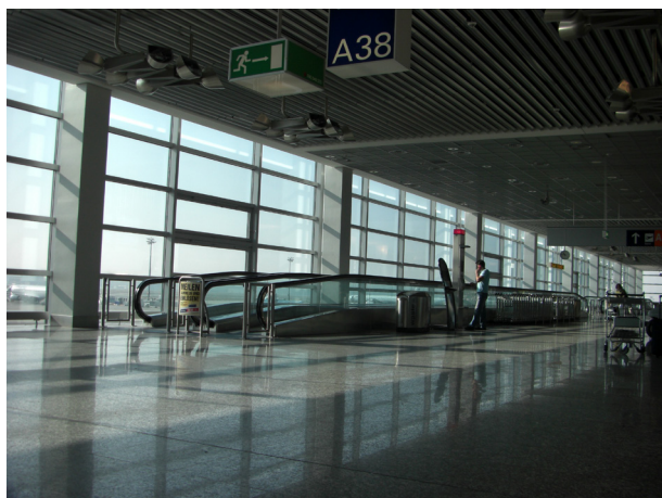
06 Meinhard von Gerkan and Jürgen Hillmer, Aeropuerto de Frankfurt, Alemania, 2012. Espacio de conexión