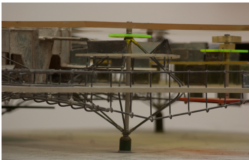
03 Constant, Detalle de maqueta del Gele Sector (Sector Amarillo) 1958.