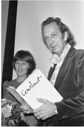
01 Fotografía de Constant en 1974.