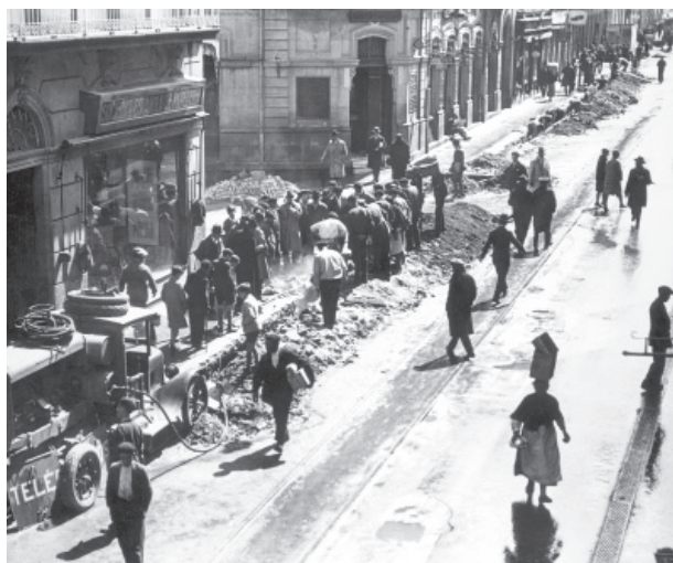
4 (Izda.) Excavación para el nuevo cableado subterráneo en Vigo, febrero de 1928.