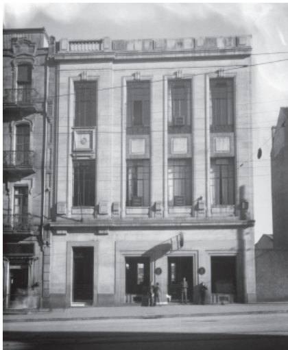
6 (Doha.) Central telefónica de Vigo en la calle Urzáiz (1928/29).