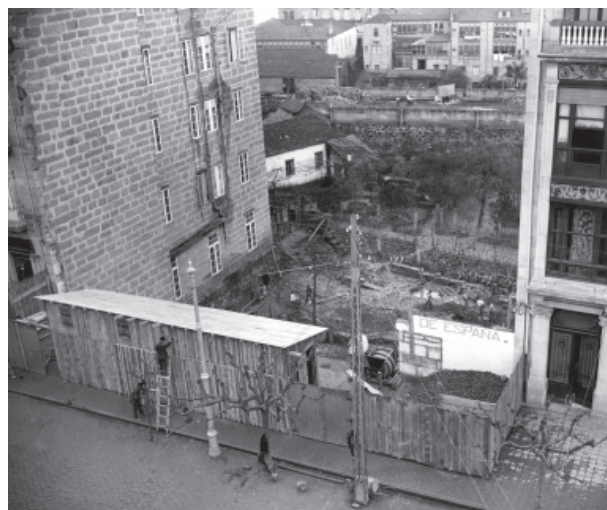
5 (Dcha.) Comienzo de los trabajos de cimentación de la central telefónica de Vigo, febrero de 1928.

Este pasaje da una pista sobre una de las causas de la gran productividad alcanzada por el Departamento: la repetición de fórmulas de eficacia contrastada.