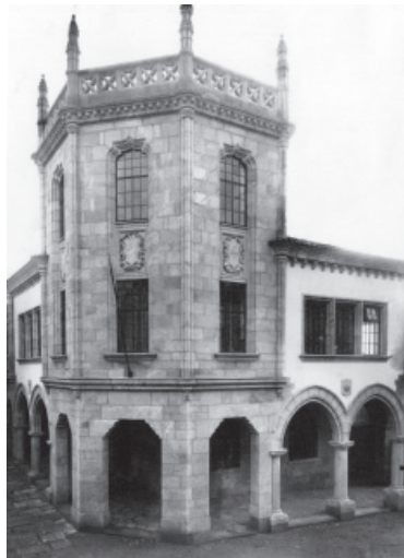
7 (Izda.) Central telefónica de Santiago de Compostela (1928/30).

trial (1927) de Manuel Gómez Román (1876-1964, t.1917), hablan del gusto vigués por la arquitectura comercial de influencia anglosajona.