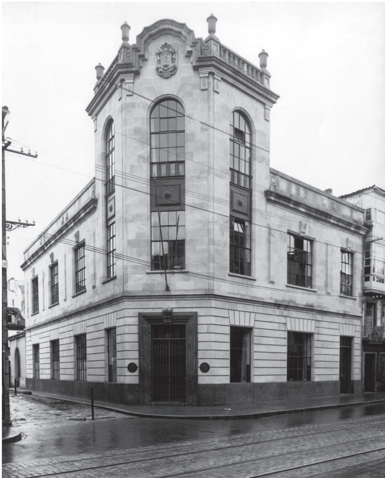
10 Central telefónica de A Coruña en la calle de San Andrés (1928/30).