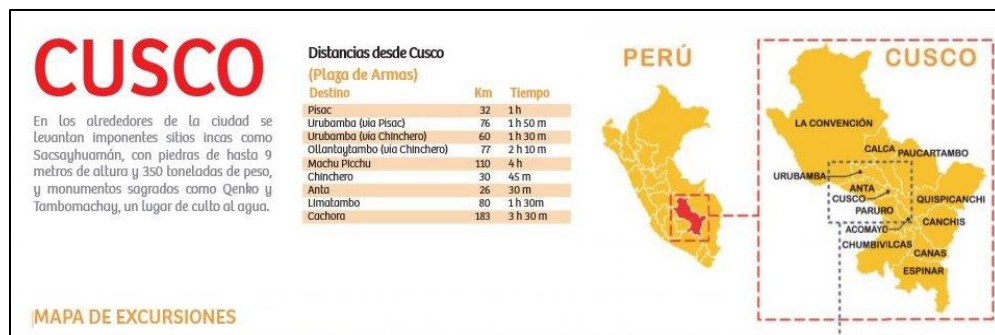
Figura 1: Mapa turístico del Departamento de Cuzco

El Departamento del Cuzco está situado al sureste del Perú, su territorio abarca desde las altas cumbres andinas hasta la selva, dividido administrativamente en 13 provincias. La región concentra una enorme riqueza patrimonial, cultural y gran parte del legado de la cultura inca y colonial. Cuzco posee atractivos turísticos de fama internacional como es el caso del Santuario Histórico de Machu Picchu, símbolo de las culturas prehispánicas de América del Sur. La ciudad del Cuzco y Machu Picchu fueron declarados Patrimonio de la Humanidad en 1983 por la UNESCO principalmente por su riqueza cultural y natural, que cada año atrae a un gran número de visitantes internacionales procedentes principalmente de Norte América y de Europa. Por lo tanto, Cuzco junto con Machu Picchu situado en el corazón del Imperio Inca se convirtió en el centro del turismo en el Perú (Ver Figura 1).