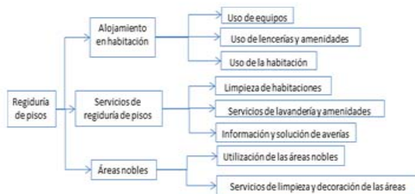
Figura 3: Diagrama Árbol que relaciona los momentos de verdad para el subproceso de Regiduría de Pisos

Los momentos críticos de verdad para Regiduría de pisos son: Alojamiento en habitación, Servicios de regiduría de pisos y Áreas nobles. Dentro de los tres momentos de verdad identificados se selecciona Alojamiento en habitación, al que se le aplica la metodología propuesta porque genera el mayor número de quejas en los clientes externos. Los Momentos de Verdad a evaluar son los obtenidos en el segundo nivel del Diagrama Árbol.