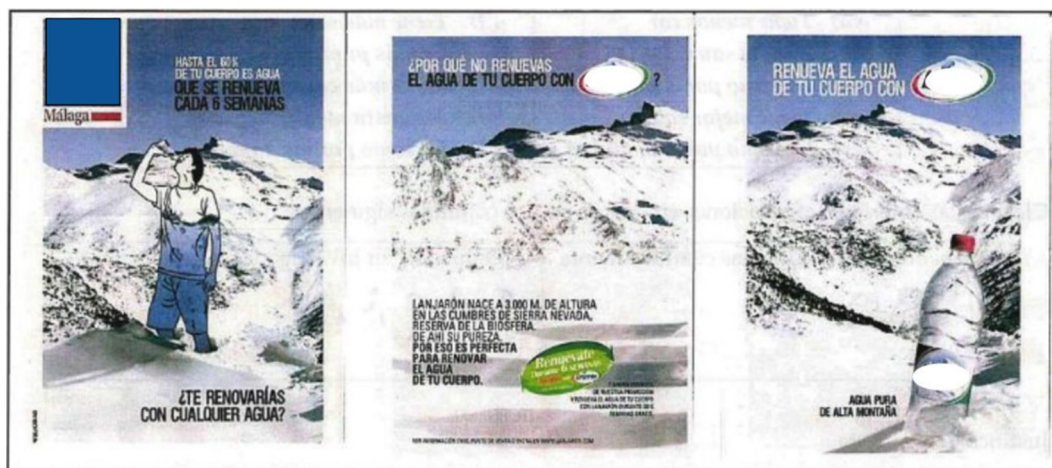
Figura 2. Imagen de la actividad sobre el agua de alta montaña.

Como tarea de argumentación debe considerarse la más compleja (nivel N3), pues el estudiante debe acudir a información variada, no explícitamente trabajada, para construir su discurso argumentativo y aportar las pruebas que considere necesarias para evaluar la afirmación suministrada.