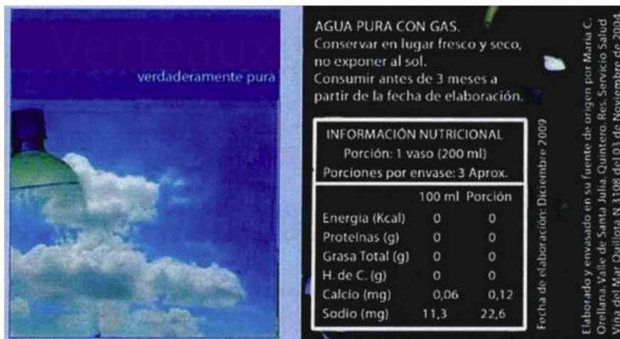
Figura 1. Imagen de la actividad sobre la pureza de agua.

Su finalidad es evaluar la capacidad de los estudiantes para diferenciar el concepto de “pura” en el ámbito de la química y en el de la vida cotidiana, que es el utilizado en la etiqueta del producto. Este concepto, así como los conocimientos químicos básicos sobre disoluciones, fueron tratados de forma explícita en el desarrollo de la propuesta didáctica.