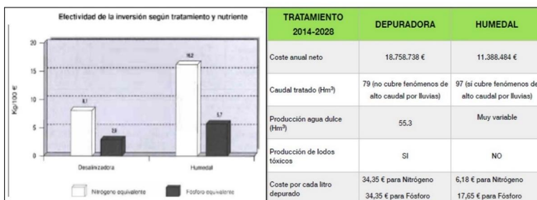
Figura 4. Materiales de la actividad “Ingenio o Ingeniería”

“¿Ingenio o Ingeniería?” Su principal propósito es contraponer para su análisis dos iniciativas de diferentes colectivos: instalar más depuradoras o aprovechar el potencial depurador de los humedales existentes en el Mar Menor. Para ello han de contrastar datos sobre efectividad, coste, contaminación, etc. (Fig. 4).