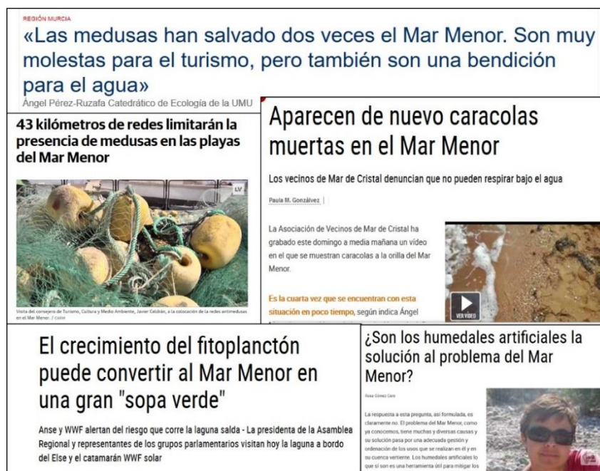
Figura 3. Materiales de la actividad “En noticia”

En la última parte de esta fase, puede ser interesante que los estudiantes comuniquen sus resultados y conclusiones mediante una exposición o un informe compartido con el resto. En cualquier caso, será importante promover una reflexión en la que contrasten sus ideas iniciales con las alcanzadas tras el desarrollo de estas actividades.